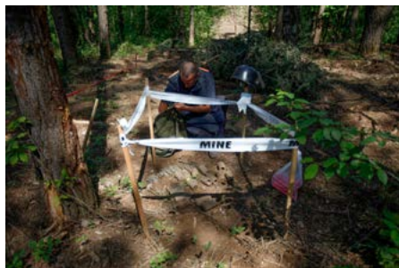
Grazie al progetto di sminamento in Croazia, la Svizzera crea un ambiente sicuro e protetto per la popolazione che vive nelle regioni minate.

Le mine e altri residui bellici esplosivi sono una pericolosa eredità della guerra in Croazia del 1991-1996. Finora 294 sminatori croati hanno bonificato una superficie di 1,8 km 2 nel bosco di Kotar-Stari Gaj, disinnescando 3585 ordigni esplosivi lasciati sul campo, che corrispondono circa al 10 % delle mine presumibilmente ancora disseminate in Croazia. Il progetto svizzero-croato è anche destinato ad aiutare le vittime e le loro famiglie attraverso l'elaborazione di apposite misure per favorire l'integrazione economica e sociale e la creazione di una banca dati nazionale per l'analisi delle loro esigenze.