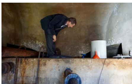
Un esperto svizzero visiona il serbatoio di acqua potabile del Comune di Fužine, costruito nel 1960.

In varie regioni della Croazia i sistemi di approvvigionamento di acqua potabile sono fatiscenti e si registrano numerose perdite nelle tubature. C'è inoltre ancora parecchio lavoro da fare per realizzare sistemi di depurazione funzionanti per gli scarichi domestici. Oggi molti abitanti raccolgono le acque reflue in fosse settiche, che possono essere serbatoi in calcestruzzo interrati oppure semplici fosse scavate nella terra, da cui l'acqua viene regolarmente pompata. Nella regione del Gorski Kotar, nel Nord-Ovest della Croazia, la Svizzera fornisce supporto a tre Comuni (Delnice, Fužine e Brod Moravice) nella costruzione e nel risanamento delle infrastrutture idriche e di scarico. Una volta redatti gli studi di fattibilità e i rapporti sull'impatto ambientale, sono stati pubblicati i bandi di concorso e hanno potuto essere avviati i lavori di costruzione.