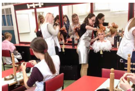
Una formazione professionale più moderna migliora le possibilità di occupazione dei giovani.