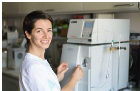
Le borse di ricerca hanno favorito la carriera di nuove leve scientifiche molto promettenti.

Grazie a una borsa di studio 22 dottorandi e post-dottorandi hanno svolto un soggiorno di ricerca in un'università svizzera. Nell'ambito di un programma di ricerca bulgaro-svizzero vengono realizzati 13 progetti. Questi due programmi hanno contribuito a garantire un migliore collegamento internazionale dei ricercatori e degli istituti di ricerca bulgari, come dimostrano i vari articoli pubblicati su rinomate riviste scientifiche specializzate.