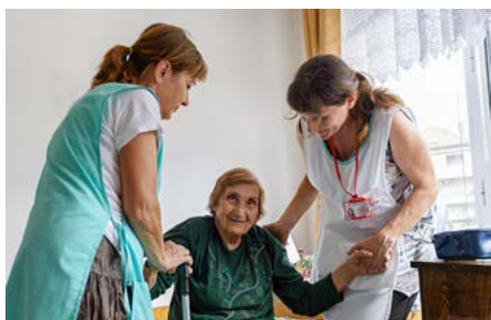
Le cure ambulantanti costano meno delle cure in ospedale e alleviano l'onere dei familiari.

Il programma svizzero sostiene il Governo bulgaro nell'attuazione della strategia nazionale concernente l'integrazione dei Rom a livello locale. L'accesso agli asili è stato migliorato grazie a nuove strutture. La scolarizzazione precoce, l'insegnamento della lingua bulgara, i corsi di ripetizione, le attività extrascolastiche e l'impiego di mediatori dell'istruzione sono mezzi efficaci per promuovere l'integrazione delle minoranze nel sistema scolastico. Ad oggi ne hanno beneficiato oltre 1950 bambini. I mediatori attivi in ambito sanitario hanno inoltre sensibilizzato più di 4700 membri della comunità rom sull'importanza di uno stile di vita sano, della prevenzione delle malattie e del supporto in caso di gravidanza.