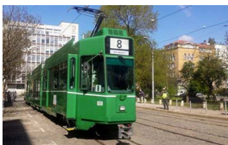
A Sofia i tram basilesi offrono ai passeggeri diversi comfort, come il pianale ribassato che facilita l'accesso alle persone disabili.