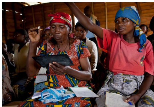
Alcune donne imparano a leggere e a scrivere e vengono informate sui loro diritti.

La DSC si occupa in particolare della dimensione medica e psicosociale nonché della reintegrazione delle vittime. Una risposta a lungo termine alle violenze sessuali e di genere nella regione dei Grandi Laghi è possibile non solo operando a livello comunitario (coinvolgendo anche gli uomini) e potenziando il sistema sanitario, ma anche e soprattutto attraverso un impegno politico serio degli Stati interessati a lottare contro l'impunità e a perseguire in modo sistematico gli autori dei crimini.