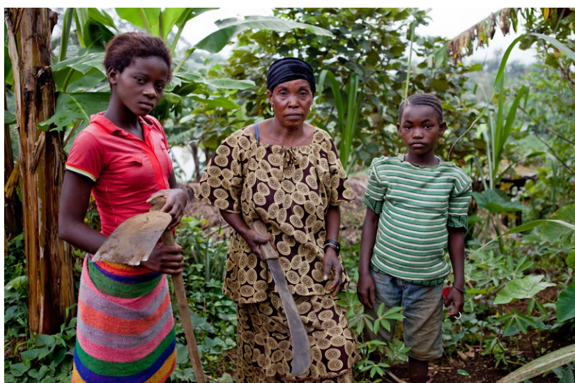
La posizione delle donne nella comunità è uno dei temi affrontati nei workshop dedicati alla sensibilizzazione.

Tema: sostegno alle vittime di violenze sessuali Paese/regione: regione dei Grandi Laghi (Burundi, Ruanda e RDC) Partner: organizzazioni della società civile, istituzioni del settore sanitario, Conferenza internazionale della regione dei Grandi Laghi (CIRGL) Scopo: le violenze nei confronti di donne, ragazze e ragazzi diminuiscono e le condizioni delle vittime migliorano. Gruppi target: vittime delle violenze sessuali e di genere Costi: ca. 3 milioni di CHF all'anno Durata: 2011 – 2017 Contatto: dsf@eda.admin.ch