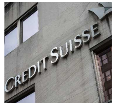
Credit Suisse guilty plea