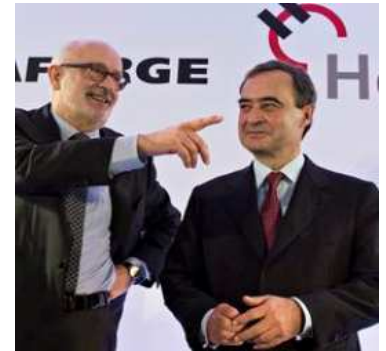
© The Guardian – Fusion Holcim-Lafarge

Durant le deuxième trimestre 2014, la couverture médiatique étrangère en lien avec la Suisse a diminué par rapport au trimestre précédent, atteignant son niveau le plus faible vers la fin du trimestre. La tonalité se révèle en revanche plus positive que durant le premier trimestre 2014. C'est ainsi par exemple que les médias internationaux ont porté un regard positif sur le rôle joué durant la crise ukrainienne par la Suisse en tant que présidente de l'OSCE. En particulier, la rencontre du 7 mai entre le président de la Confédération Didier Burkhalter et le président russe Vladimir Poutine a bénéficié d'un écho médiatique important. L'accord (« Guilty plea ») conclu entre le Credit Suisse et le département de justice des Etats-Unis a en revanche fait l'objet de comptes rendus plus critiques. Le net rejet de l'initiative sur les salaires minimums, la fusion des cimentiers Holcim et Lafarge ainsi qu'un rachat par le groupe pharmaceutique bâlois Novartis dans le domaine oncologique ont en outre suscité un vif intérêt médiatique. La tonalité des comptes rendus publiés sur ces thèmes est restée factuel.