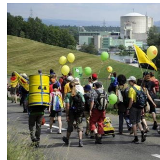
Teilnehmer eines Anti-Atomkraft-Protests bei Beznau (© Corriere della Sera).