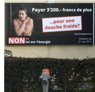
Nein-Kampagne zur Abstimmung über das revidierte Energiegesetz.

angreifbar für Vorwürfe, ein nationales Interesse am Geschäft mit Schwarzgeld zu haben. Obwohl die Tonalität der deutschen Medienberichte überwiegend negativ ist, wird in den Artikeln darauf verwiesen, dass die Folgen das gute deutsch-schweizerische Verhältnis nur kurzfristig trüben dürften. Vereinzelt werden auch Kommentare publiziert, die Verständnis für das Vorgehen der Schweiz zeigen. In den internationalen Medien wird über die Affäre um Spionagevorwürfe weniger ausführlich und mit einer sachlicheren Tonalität als in Deutschland berichtet.