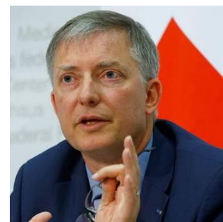
Der Direktor des Nachrichtendienstes des Bundes, Markus Seiler.