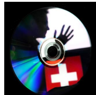
Mutmasslicher Schweizer Spion in Frankfurt festgenommen (© Spiegel Online).