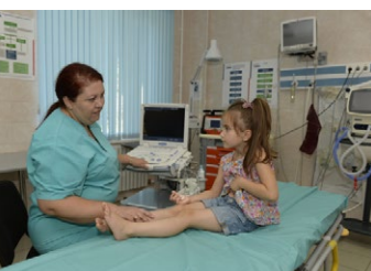
Die DEZA unterstützt Moldova darin, dass Kinder in allen Regionen des Landes die bestmögliche medizinische Versorgung erhalten.

schäftliche Entwicklung. Damit die Wirtschaft zum Nutzen aller nachhaltig wachsen kann, muss der Privatsektor seine Produktivität und Wettbewerbsfähigkeit steigern. In diesem Zusammenhang werden bestimmte Marktsysteme mit einem ganzheitlichen Ansatz beleuchtet, damit der Privatsektor ermöglicht wird zu wachsen sowie mehr und bessere bezahlte Jobs schaffen zu können.