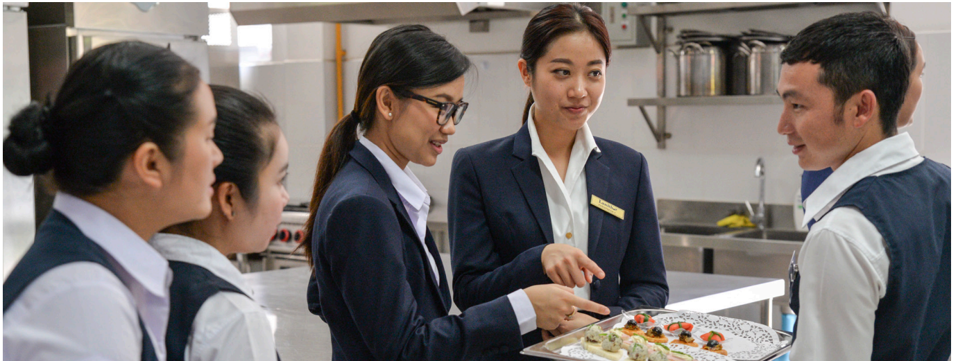
ການຝຶກອົບຮົມ ກ່ຽວກັບ ການທ່ອງທ່ຽວ ແລະ ການໂຮງແຮມ ຢູ່ ສູນ LANITH ທີ່ ນະຄອນຫຼວງວຽງຈັນ, ສປປ ລາວ.

SDC ແມ່ນ ອົງການຮ່ວມມືສາກົນຂອງສະວິດເຊີແລນ ພາຍໃຕ້ການຄຸ້ມຄອງຂອງ ກະຊວງການຕ່າງປະເທດແຫ່ງສະຫະພັນທະລັດ ສະວິດເຊີແລນ. ໂດຍການປະສານສົມທົບກັບ ຫ້ອງການສະຫະພັນອື່ນໆ, SDC ມີພາລະໜ້າທີ່ ປະສານງານ ກິດຈະກຳຮ່ວມມືໂດຍລວມ ໃນບັນດາປະເທດກຳລັງພັດທະນາ, ການຮ່ວມມືກັບ ສະຖາບັນຮ່ວມມືຫຼາຍຝ່າຍ, ການຮ່ວມມືກັບ ພາກພື້ນ ເອີຣົບຕາເວັນອອກ ແລະ ການຊ່ວຍເຫຼືອດ້ານມະນຸດສະທຳ ໂດຍ ສະຫະພັນທະລັດ ສະວິດເຊີແລນ.