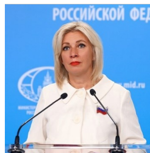
Maria Zakharova, porte-parole du ministère russe des Affaires étrangères, évoque la dégradation des relations entre la Suisse et la Russie.