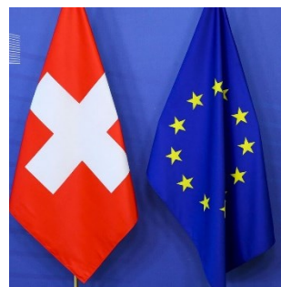
En 2021, la Suisse avait interrompu les négociations avec l'UE. Le gouvernement suisse et la Commission européenne entendent donner un nouvel élan à leurs relations.

en Suisse l'Europe et les relations de la Suisse avec l'UE. L'élaboration d'un mandat de négociation avec l'UE, annoncée par le Conseil fédéral, et l'adoption du projet correspondant en décembre sont tout d'abord relayées de manière concise et factuelle par les médias étrangers; certains d'entre eux émettent ensuite des avis différents sur cette reprise envisagée des négociations, y consacrant des commentaires approfondis.