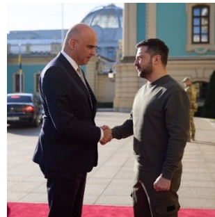
Le président de l'Ukraine Volodymyr Zelensky accueille le président de la Confédération Alain Berset à son arrivée à Kyiv, en novembre.

mois de novembre, les médias internationaux ont fait pour la plupart une analyse objective de la revente à l'Allemagne de 25 chars Leopard-2, que le Conseil fédéral a approuvée à la condition que les chars ne soient pas exportés vers l'Ukraine. En revanche, la loi helvétique sur le matériel de guerre, jugée restrictive, et l'interprétation que la Suisse fait de sa neutralité laissent toujours sceptiques en Allemagne. La visite du président de la Confédération Alain Berset à Kyiv a été accueillie favorablement, en particulier dans les médias d'Europe de l'Est. De leur côté, les médias russes se sont montrés résolument critiques à l'égard des relations entre la Suisse et la Russie, citant souvent le ministère russe des Affaires étrangères, selon lequel le dialogue entre les deux pays est désormais quasi inexistant. Ils continuent par ailleurs de déclarer que la Suisse n'est plus neutre et qu'elle a clairement porté préjudice à sa place financière en reprenant les sanctions de l'UE.