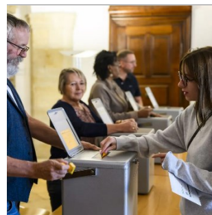
Dans une école à Delémont, une électrice glisse dans l'urne son bulletin de vote aux élections législatives du 22 octobre.

Europe. Les médias relèvent que la question migratoire était le sujet principal de ces élections et de l'UDC, tandis qu'aucune place n'a été accordée à des thèmes comme le changement climatique ou la chute de Credit Suisse. Les erreurs de calcul des voix survenues à l'Office fédéral de la statistique ont été surtout rapportées par des médias étrangers germanophones, suscitant des commentaires parfois amusés qui s'appuyaient sur les clichés habituels concernant la précision suisse. Le renouvellement intégral du Conseil fédéral a également été relayé principalement par des médias allemands, qui dans ce contexte ont présenté dans le détail le système politique suisse.