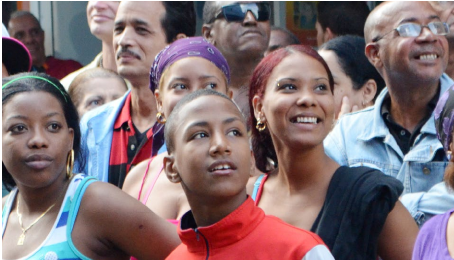
«Das ideale Wohnviertel träumen und verwirklichen, ist Aufgabe aller» – Bewohner von Alt-Havanna.

Einer der Schwerpunkte der Reformen, die die kubanische Regierung vorantreibt, besteht in der Dezentralisierung des Landes, die den lokalen Akteuren eine grössere Gestaltungsfreiheit einräumen soll. In städtischen wie ländlichen Wohnvierteln und Gemeinden entstehen Initiativen zur Förderung einer neuen Form von Bürgerbeteiligung, bei der die Entscheidungsfindung von unten nach oben verläuft. Die Schweizer Entwicklungszusammenarbeit unterstützt eine Reihe von Vorhaben, mit denen dieser innovative Prozess im Kontext Kubas gefördert werden soll, der bis vor kurzem von einer zentralistischen Verwaltung geprägt war.