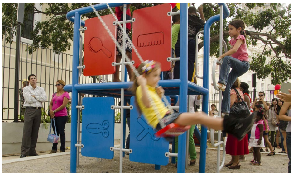
«Es geht nicht nur darum, die Gebäude zu sanieren, sondern in die Menschen zu investieren.»