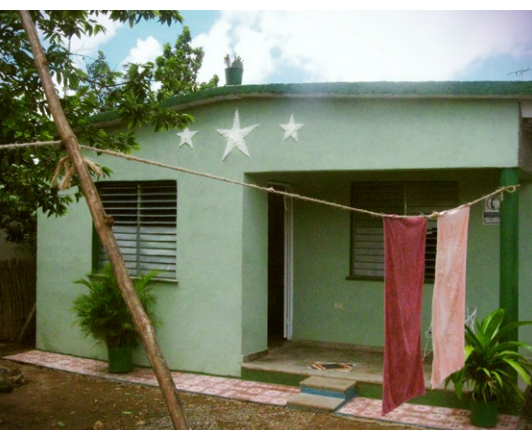
Mit lokalen Mitteln im Rahmen des Projekts PRODEL errichteter Neubau in Aguada de Pasajeros.

«Dank der vom CEDEL bereitgestellten Technologie können wir eine Strategie verfolgen, die es uns ermöglicht, die Gemeinde anhand der aktualisierten Ortsplanung in ihrer Gesamtheit zu betrachten. Somit verfügen wir nun im Gegensatz zu früher, als wir praktisch ohne Informationen arbeiteten, über eine Untersuchung zum Gebiet. Wenn eine mehr oder weniger gut gemachte Ortsplanung vorliegt, können Lösungen für alle Probleme in der Gemeinde gefunden werden. Die Raumplanung trägt den Belangen der Bevölkerung in Bezug auf Wohnungen, Verkehr und technische Infrastruktur Rechnung. Zu ihrer Erarbeitung wurde zunächst auf der Grundlage einer partizipativ angelegten Methodik eine Reihe von Workshops organisiert. Danach fanden mehrere Zusammenkünfte mit dem Gemeinderat zu den Grundzügen der Ortsplanung statt. Schliesslich wurde sie in der Gemeindeversammlung angenommen. Ein langwieriger und komplexer Prozess.»