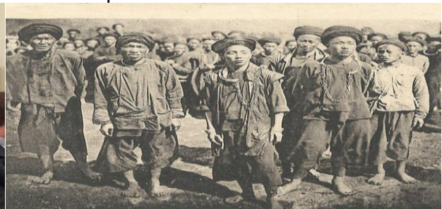
Left: Scholars debated the author's views. Right: Hmongs (archiv)