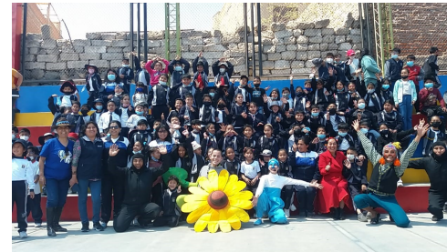
Fosty en Mollendo, Arequipa.

El espectáculo "Fosty, la gota de agua guardiana de la naturaleza", promovido por COSUDE y el Fondo Cultural Suizo, ha finalizado su gira peruana con 3 fechas en Lima. La obra, basada en un libro suizo y dirigida especialmente a los niños, pretende compartir un mensaje de sensibilización sobre el acceso al agua, la protección del medio ambiente, así como los retos a los que se enfrentan las generaciones futuras, a la vez que lleva la imaginación a un viaje. Estas últimas actuaciones marcaron el final de una intensa gira que recorrió 7 regiones del país de norte a sur y fue vista por miles de niños peruanos.