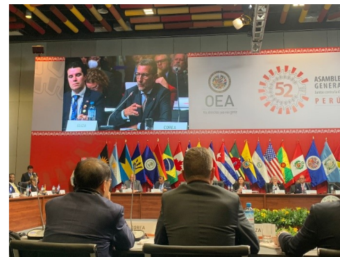
Discurso Embajador Giulietti en la OEA

La 52ª Asamblea General de la OEA se celebró en Lima del 5 al 7 de octubre de 2022. Suiza, como Estado observador permanente, desempeñó un papel destacado participando activamente en el diálogo de los Estados observadores y organizando un acto paralelo oficial sobre el Documento de Montreux en materia de derecho humanitario internacional, con la participación del Comité Internacional de la Cruz Roja en el Perú y de