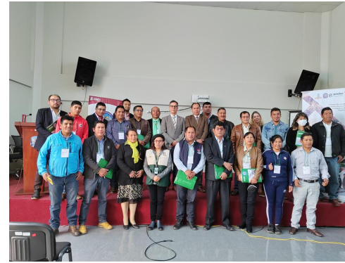
Embajador Garnier con alcaldes de Cusco

inundaciones, los incendios y los terremotos. El inicio del mandato de las nuevas autoridades en 2023 y el cambio de los equipos con responsabilidades en los procesos de gestión del riesgo de catástrofes coinciden con las estaciones lluviosas, reforzadas por la probable presencia del fenómeno de La Niña. Por ello, el Embajador Paul Garnier y el equipo de la Ayuda Humanitaria de COSUDE Lima se desplazaron a Cusco para trabajar con los nuevos alcaldes de la región en el fortalecimiento de la gobernabilidad de riesgo y la coordinación con el nivel nacional.