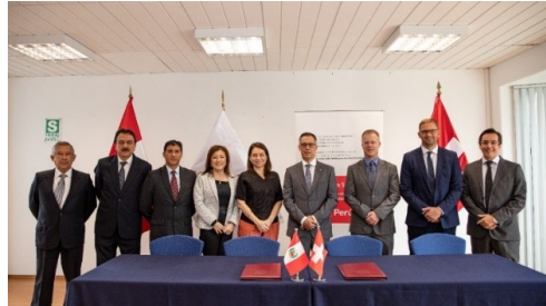
SECO y PromPeru en firma de Memorando

En el marco del Programa Suizo de Promoción de Importaciones (SIPPO), SECO firmó un Memorando de Entendimiento con PromPerú, la agencia oficial del Ministerio de Comercio Exterior y Turismo para la promoción del país en las áreas de comercio exterior, turismo e inversiones. PromPerú es un socio importante para la