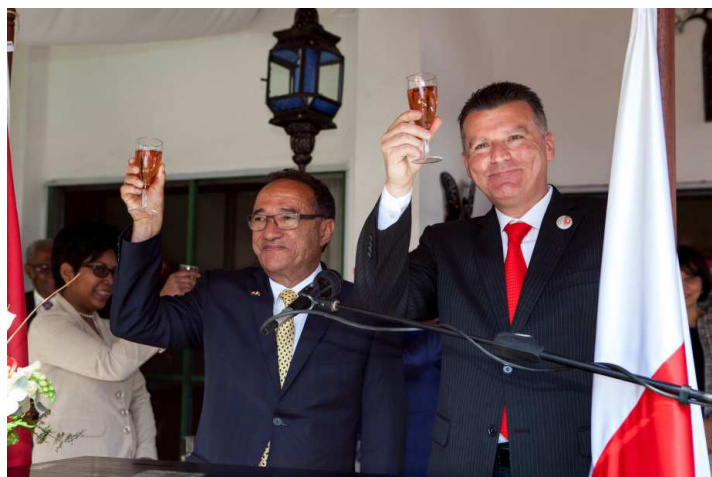
Le toast du 1 er août à la Résidence de Suisse