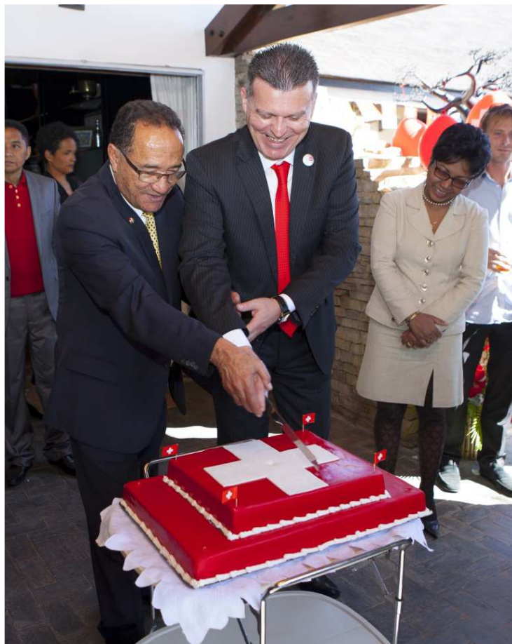
L'Ambassadeur et le Premier Ministre coupant le gâteau de l'amitié

Conformément à la tradition, l'Ambassadeur Eric Mayoraz a convié le 1er août dernier la communauté suisse, les autorités malgaches, le corps diplomatique et les partenaires de l'Ambassade à la célébration de notre fête nationale à la Résidence de Suisse à Ambohibao. Plus de 350 invités ont répondu à l'appel et ont célébré dans la bonne humeur cet événement sous un soleil radieux, en dégustant les spécialités suisses élaborées à Madagascar, notamment la viande séchée, les pains de tous les cantons suisses, les saucisses de veau et les schübligs de notre compatriote le Chef Albert Wagner de Mantasoa, sans oublier bien entendu la délicieuse raclette au fromage d'Antsirabe, le tout arrosé de vins suisses.