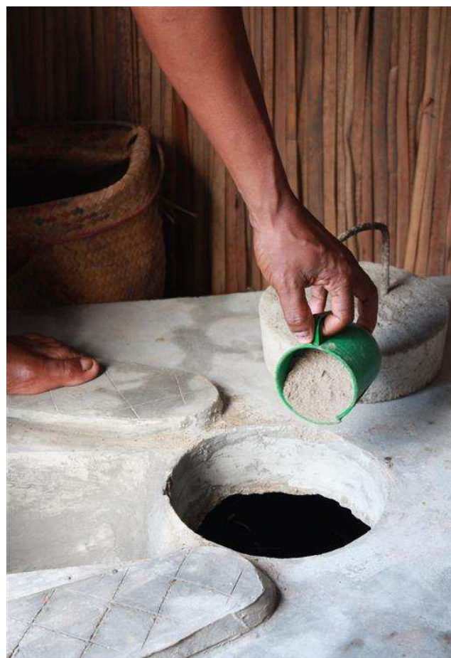
Ne pas oublier la matière sèche après utilisation de la latrine !

Le voisinage est désormais en paix car il n'y a plus de conflit au sujet des mauvaises odeurs ou encore des poussins qui tombent dans les fosses. Cela a fait une grande différence. De plus, nous ne craignons plus que les déchets se répandent en cas d'inondation comme c'est le cas avec les tinettes ou les latrines traditionnelles. »