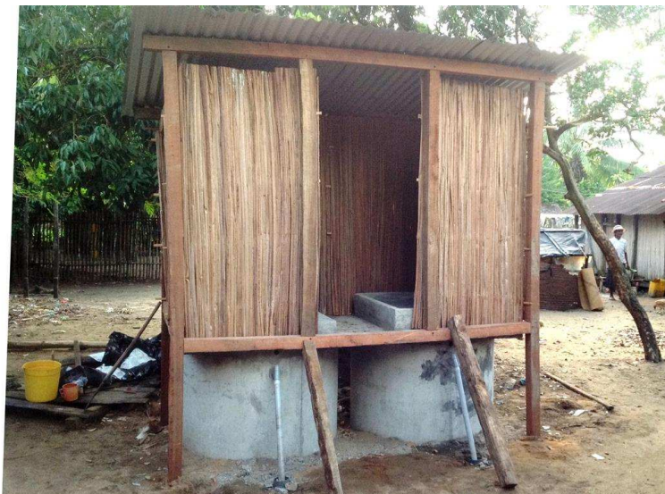
Construction d'une latrine EcoSan améliorée type Medair

Dorice, propriétaire d'une latrine EcoSan Medair nous raconte :