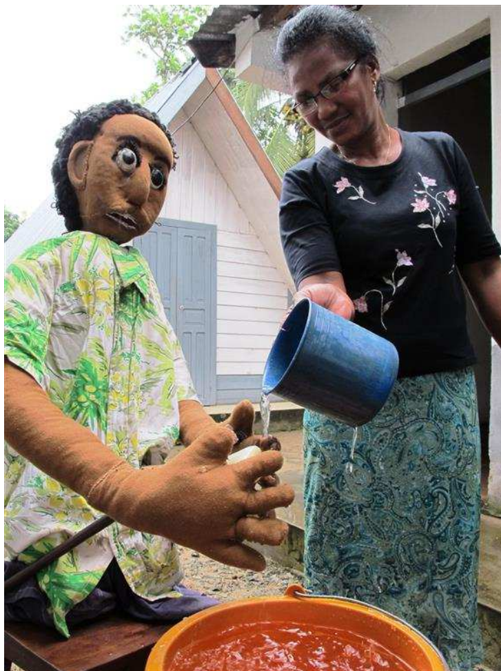
Boaliky la marionnette se lave les mains pour montrer le bon exemple

Le projet en cours, Rano Tsara 2 2 (bonne eau en malgache) lancé en 2013, prévoit de fournir de l'eau propre à 113 200 utilisateurs dans les communes rurales des districts de Maroantsetra et Mananara-Nord et de faire construire et vendre 800 latrines EcoSan améliorées dans la commune urbaine de Maroantsetra. Latrine améliorée ? Oui ! Car ce que les habitants de Maroantsetra appellent le « kabone ladosy » ou encore le « rao lavaka » est en réalité une latrine surélevée à double buse équipée d'une cabine de douche juxtaposée. Une première buse est située sous la latrine et la seconde sous la douche. L'objectif de cet ajout étant de faciliter le séchage des matières fécales en permettant aux utilisateurs de se servir de la seconde buse une fois que la première est pleine. Cela se fait tout simplement en permutant la dalle latrine et la dalle douche. La latrine est également munie d'une aération supplémentaire, pour réduire davantage les odeurs, et