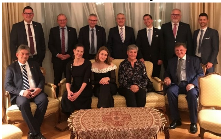
Im Salon der Residenz des schweizerischen Botschafters

Nachdem der Besuch der parlamentarischen Freundschaftsgruppe Schweiz-Ungarn wegen der Corona-Pandemie mehrmals verschoben werden musste, war es Anfang Oktober endlich soweit.