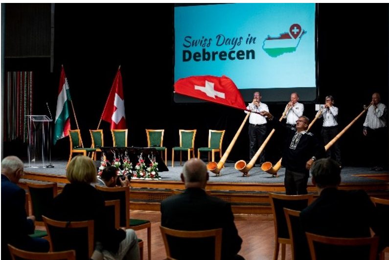
«Swiss-Hungarian Business Forum» in Debrecen mit Mitgliedern der Alphorn Akademie

Mit einem Schweizer Pavillon im Deutschen Kulturforum, einem schweizerisch-ungarischen Wirtschaftsforum über Innovation und Kooperationsmöglichkeiten, Präsenz in Schulen und an der Universität mit Konferenzen,