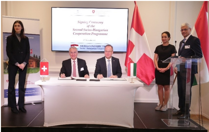
Botschafter Paroz und Minister Navracsics bei der Unterzeichnung des Kooperationsabkommens / Foto: D avid Harangoz , Diplomacy & Trade

Unter feierlichen Bedingungen fand im Anschluss die Unterzeichnungszeremonie f r das bilaterale Abkommen im Rahmen des zweiten Schweizer Beitrags statt. Zun chst begr ssteten Botschafter Paroz und Andrea Studer, Vize-Direktorin der DEZA, sowie der ungarische Minister f r Regionalentwicklung, Tibor Navracsics, die Anwesenden. Die einzelnen Programmelemente wurden von Roland Python, dem Direktor des B ros des zweiten Schweizer Beitrags, und vom stellvertretenden Staatssekret r im Ministerpr sidentenamt, Gergely Vartus, vorgestellt. Gef rdert werden Projekte, die zum Wirtschaftswachstum, zum Aufholen benachteiligter Regionen, zur Schaffung von Arbeitspl tzen, zum Umweltschutz, zur F rderung von Forschung, Entwicklung und Innovation sowie einer Verbesserung im Gesundheitssektor beitragen. Die stellvertretende Staatssekret rin des Innenministeriums, Judit T th, spannte den Bogen zum Vormittag und gab Einblicke in jene Programme, welche im Gesundheitssektor umgesetzt werden sollen, bevor der Anlass schliesslich durch den formellen Akt der Unterzeichnung durch Botschafter Paroz und Minister Navracsics abgeschlossen wurde.