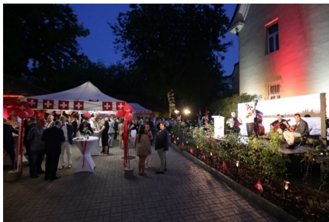
Feierlichkeiten bei Schweizer Raclette und ungarischer Musik

Der offizielle Empfang am 1. August in der Botschaft anlässlich des Nationalfeiertags ist traditionell eine festliche Gelegenheit, den Geburtstag der Eidgenossenschaft mit unseren institutionellen Partnern zu begehen, nachdem der vom Schweizer Verein organisierte Anlass es uns möglich machte, diesen mit unseren Mitbürgerinnen und Mitbürgern zu feiern.