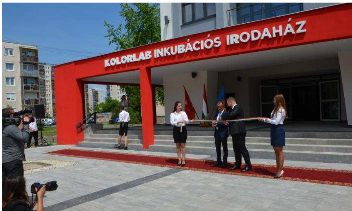
Feierlich eröffnen Herr Botschafter Burkhard und Bürgermeister Péter Szitka das Kolorlab Inkubator Bürogebäude / Burkhard nagykövet úr Szitka Péter polgármester úr társaságában ünnepélyesen megnyitja a Kolorlab Inkubációs Irodaházat

Ennek a vidékfejlesztési és munkahely-teremtési projektnek köszönhetően, Kazincbarcikán és a város vonzáskörzetében az üzleti és társadalmi élet felpetzdült, jelentős helyi értékek kerültek továbbfejlesztésre, amelyeket a lakosság és az odalátogatók is megtapasztalhattak, mind a városban, mind pedig a környező településeken is, pl. Bánhorvátiban, Rudabányán és Sajókazán. Öröndetes az is, hogy a létrehozott helyszínek és programok mindenki előtt nyitva állnak, és társadalmi, kulturális központként szolgálnak a társadalom különböző csoportjai részére. Nem utolsósorban a város neve hallatán most már egy teljesen új kép és egy újfajta minőség jelenik meg az emberek előtt, ami önmagában is nagy teljesítmény. Svájc 1,3 milliárd forinttal (4,8 millió svájci frank) támogatta a projektet, míg a magyar állam a költségek 15%-át vállalta át.