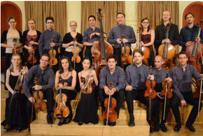
Das Kammerorchester Anima Musicae gab zu Ehren des 125. Geburtstages von Arthur Honegger ein Konzert / Az Anima Musicae Arthur Honegger 125. születésnapja alkalmából adott koncertet

Das Budapester Frühlingfestival wurde mit dem Konzert von Bertrand de Billy und dem Kammerorchester von Lausanne am 31. März in der Liszt-Musikakademie eröffnet.