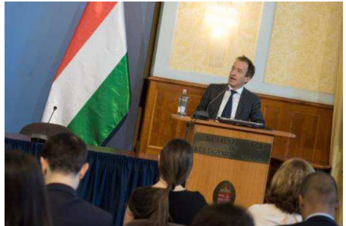
Botschafter Burkhard eröffnet die IHR-Konferenz / Burkhard nagykövet úr megnyitja a konferenciát

értelemben háborúnak nevezni. Ebben a témában május 11.-én került megrendezésre Budapesten egy nemzetközi konferencia, melyet a Magyar Külgazdasági és Külügyminisztérium és a Svájci Külügyminisztérium Nemzetközi jogi osztálya közösen szerveztek. A több mint 10 országból érkező előadók erről az aktuális témáról értekeztek. A nap végén Burkhard nagykövet úr vendégül látta a résztvevőket egy vacsorára a Dunán.