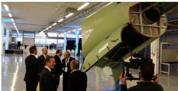
Rundgang im Flugzeugteile-Werk von Ruag Aerostructures / Látogatás a Ruag Aerostructures repülőgép-alkatrész gyárban

Die Schweiz und Ungarn sind bestrebt, die bilateralen Wirtschaftsbeziehungen zueinander weiter auszubauen und zu stärken. Diese Absicht bekräftigte die ungarische Diplomatie Anfang 2017 durch den Einsatz eines zweiten Aussenwirtschaftsattachés an der Botschaft in Bern. Darüber hinaus erklärte sich die Investitionsförderungsagentur HIPA bereit, den Swiss Business Day, der am 22. November 2017 zum vierten Mal stattfinden wird, aktiv zu unterstützen. Ein drittes Indiz ist die Aktivität der in Ungarn ansässigen Schweizerfirmen, denn im 1. Halbjahr 2017 machten diese wieder deutlich, dass sie sich am Standort Ungarn insgesamt wohl fühlen und ihr Engagement auch weiter ausbauen wollen. Damit tragen sie oft auch zur Zukunftssicherung historisch bedeutender Ortschaften bei.