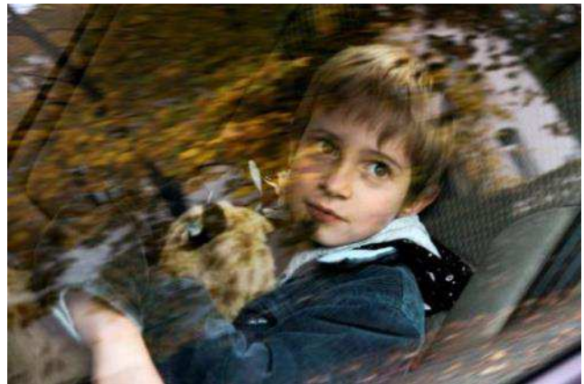
Finsteres Glück, der neue Film von Stefan Haupt erzählt eine zarte, höchst ungewöhnliche Geschichte über Zugehörigkeit, Geborgenheit und Liebe / Stefan Haupt új filmje, a „Napfogyatkozás” egy különleges történetet mesél el a hovatartozásról, biztonságról és szeretetről

Nagy örömünkre szolgál, hogy tájékoztathatjuk: már