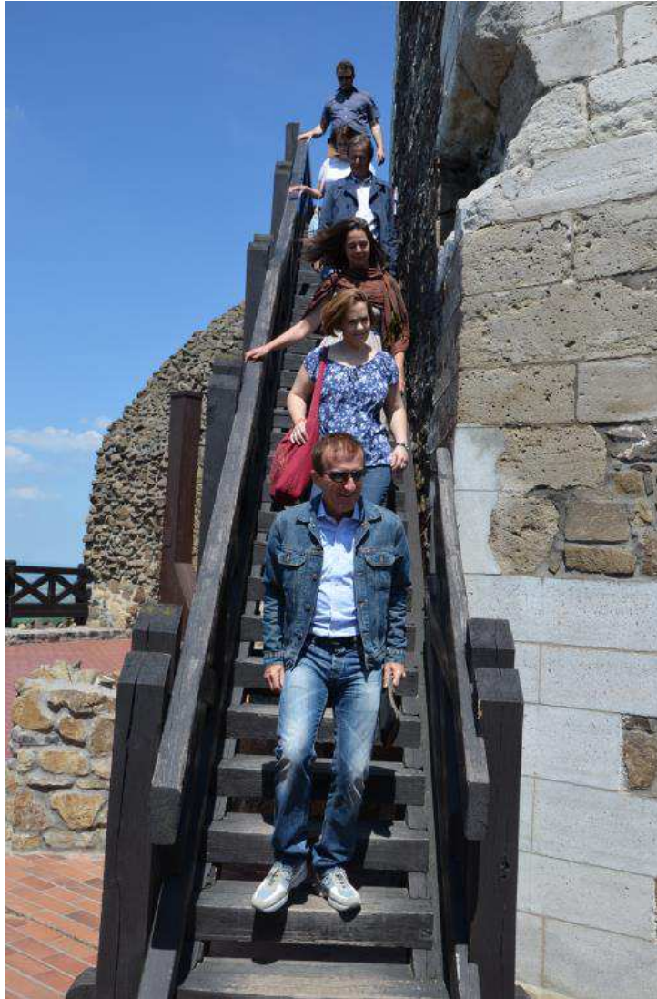
Die Mitarbeiter der Botschaft in der Burg Hollókő / A követség munkatársai a Hollókői várban