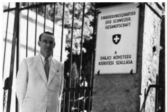
Carl Lutz in den 40er Jahren vor dem Evakuierungsquartier / Carl Lutz a 40-es években a svájci kiürítési szállás előtt

Die Schweiz ist für gewöhnlich vorne mit dabei, wenn es um internationale Kooperation im Bereich Menschenrechte und Humanitäres geht. So wissen die Meisten, dass die Rotkreuzbewegung und ihre Fahne ihren Ursprung in der Schweiz hatten und wichtige Verträge des Humanitären Völkerrechtes unter dem Namen „Genfer Konventionen“ zusammengefasst werden. Die Botschaft ist auf diesem Gebiet ebenfalls aktiv, und möchte der Ungarischen Bevölkerung auch diese Seite der Schweiz bekannt machen. Dieses Jahr ist es uns in drei Rahmenprojekten möglich: