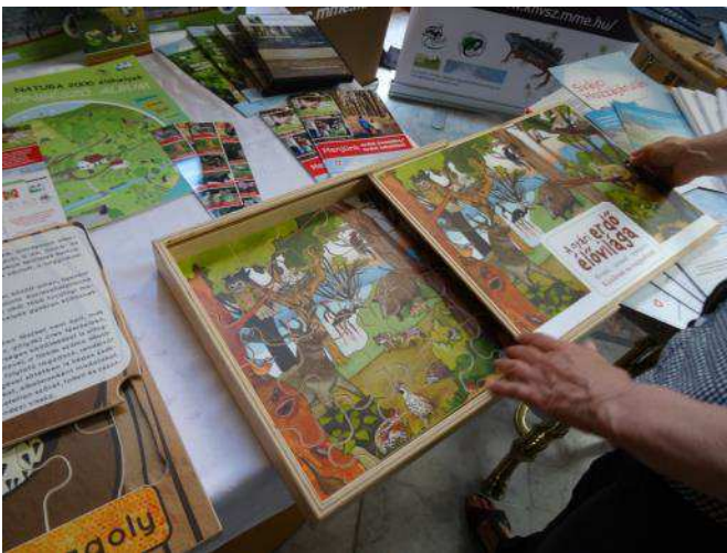
Die Publikationen und Spiele über Naturschutz werden präsentiert / A természetvédelemmel kapcsolatos publikációk és játékok bemutatása

Auf Schweizer Seite zog man die Schlussfolgerung, dass die Auswahl der Projekte vor zehn Jahren von grosser Bedeutung war, da diese den tatsächlichen Bedürfnissen der ungarischen Partner und den Herausforderungen der heutigen Gesellschaft entsprachen. Darüber hinaus wurde durch das Gemeinschaftsprojekt eine engere Beziehung zwischen der Schweiz und Ungarn hergestellt; nicht nur auf Regierungsebene, sondern auch zwischen Städten, Gemeinden, Universitäten, nichtstaatlichen Organisationen und auch zwischen den Bevölkerungen. Herr Maître betonte in seiner Schlussrede, dass der Nachhaltigkeitsaspekt in der Abschlussphase, und auch darüber hinaus, von grosser Wichtigkeit bleibt. Er äusserte zudem den Wunsch, dass die Partnerschaft zwischen Ungarn und der Schweiz auch nach Beendigung der Projekte fortauern und weiter wachsen solle.