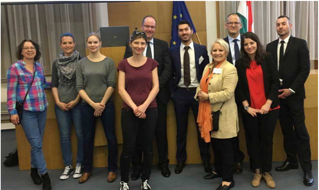
Die schweizerische Delegation im Ungarischen Innenministerium / A svájci delegáció a Magyar Belügyminisztériumban

Emberkereskedelmi Osztályával együttműködve kidolgozott egy programot, melynek keretében három szakmai látogatásra kerül sor a két ország között. A Svájci delegáció májusban három napot töltött Budapesten, Miskolcon és Nyíregyházán, megismerhette a magyar partner-szervezeteket és a helyi rendőrkapitányságokat, valamint bepillantást nyerhetett azokba a nehéz életkörülményekbe is, amelyekből a nők Svájcba érkeztek – és ahová sokszor vissza is kell térniük. Szeptember elején lesz a második utazás, amikor a magyar partnerek utaznak majd Svájcba, hogy megismerkedjenek az ottani rendszerrel és partnerekkel. Ez azért fontos, mert csak akkor tud a két ország igazi védelmet nyújtani az emberkereskedelem áldozatainak, ha a hivatalok és a civil szervezetek megbíznak egymásban és hatékonyan dolgoznak együtt.