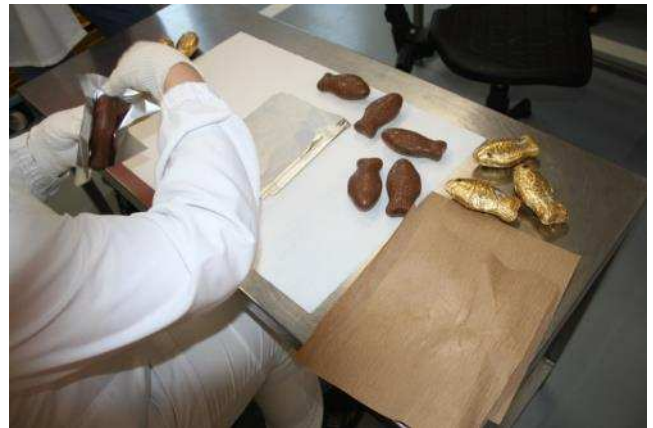
Verpackung von Schokoladenhohlfiguren bei Nestlé / Csoki figurák csomagolása a Nestlé gyárban

Jóllehet történelmi vár is van Miskolc Diósgyőr városnegyedében, ám a Swisscham kirándulás résztvevői június 29.-én – nem elítélhető módon – ezúttal előnyben részesítették a szintén e helyen található svájci csokoládégyár megtekintését. 1991 óta gyárt itt a Nestlé csoki-figurákat, melyek 5 kontinensen, 25 országban, nem csupán Karácsonykor és Húsvétkor dobogtatják meg a gyermekszíveket. A svájci konzern nagy hangsúlyt fektet arra, hogy tevékenysége által olyan eredményeket tudjon felmutatni, melyek nem csak a vállalatra, hanem a társadalomra és az országra is pozitív hatással vannak. Amennyiben felkeltettük érdeklődését, hogy hogyan készülnek Miskolcon a Nestlé csoki figurák, tekintse meg az alábbi (magyar nyelvű) kisfilmet: https://www.youtube.com/watch?v=mEbT5NAXjeU