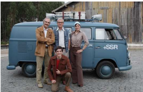
Filmfoto „Les Grandes Ondes (à l'ouest)“ Filmkép „Hosszúhullám“

Minden év áprilisában felvidul a magyar könyvszerető emberek kedélye: a Nemzetközi Könyvfesztivál keretében az egész világról érkeznek írók Budapestre, és a Millenáris négy napra megtelik könyvre éhes olvasókkal. Svájc évek óta részt vesz az Európai Elsőkönyvesek Fesztiválján. Idei fiatal írónőnk, Yael Pieren „Storchenbiss“ című könyvét huszonevésen írta. Április 25-én osztrák kollegájával, Harald Darer-ral együtt olvasott fel az Osztrák Kulturális Fórum könyvtárában. Idén először Svájc is részt vett a „Frissen a nyomdából” standon a német és az osztrák frissen megjelent könyvek mellett. Hála a Pro Helvetia Alapítvány támogatásának, követségünk bemutathatta a széles közönségnek a legújabb svájci sakkönyveket és regényeket.