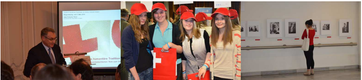
Botschafter Paroz an der AUB Paroz nagykövet úr az AUB-n

A 2014-es Frankofón Filmnapok közönségdíját a svájci film, „Les Grandes Ondes (á l'ouest)“ nyerte! Lionel Baier önkritikus humora az 1974-es portugál szezifűs forradalomba keveredett svájci rádiós újságírókról szóló filmjében meggyőzte a nézőket. Paroz nagykövet ezzel a filmmel nyitotta meg a Francia Filmnapokat Szegeden március 14-én. Igaz, franciabarát olvasóink tudják, Magyarországon az egész március a francia nyelvű. A nagykövet kezdeményezésére idén először egész napos konferencia került megrendezésre „Frankofónia Kelet- és Közép-Európában” címmel az ELTE-n. A „Coup de Coeur de l'Ambassadeur” sorozat is Paroz nagykövet ötletén alapszik: a diplomaták hagyják el irodájukat, menjenek el iskolákba és egyetemekre, hogy megmutassák a fiataloknak, mi is az, ami igazán közel áll a szívükhöz. A svájci nagykövetnek jelenleg Svájc humanitárius hagyománya, de erről majd lent írunk bővebben. Egy Frankofónia Ünnepe sem múlhat el gálaest nélkül és idén – mindenki megkönnyebbülésére - ismét nem maradt el a közkedvelt Raclette sajt sem. Bon appetit!