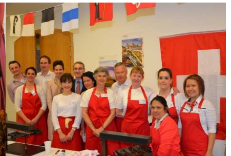
Der Schweizer Stand am Soirée de Gala A svájci stand a gálaesten