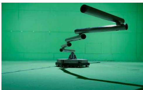
Installation „Cycloid-E“ von CodAct/ „Cycloid-E“ installáció, Cod Act