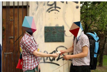
Projekt der Kunsttruppe „Wir waren's nicht“/ A „Nem mi voltunk“ projektje