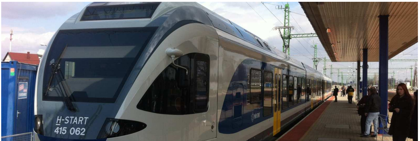
Auslieferung des ersten zwei von 42 Triebzügen am 19. März 2014 / A 42 darabos rendelés első két vonatának átadása 2014. március 19-én