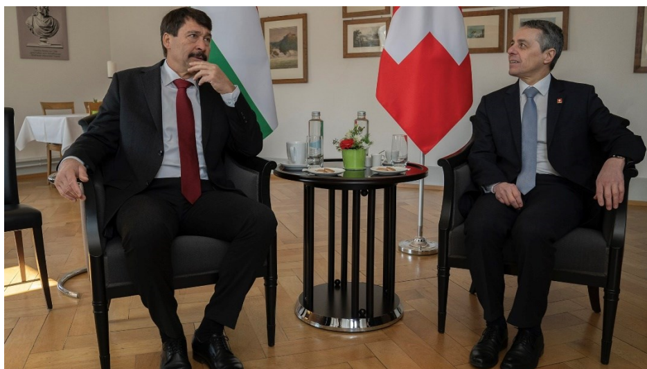
Präsident Áder und Präsident Cassis

Bundespräsident Ignazio Cassis hat am 9. März 2022 den damaligen ungarischen Präsidenten János Áder in Neuhausen empfangen. Es handelte sich dabei um die letzte Auslandsreise von Präsident Áder, was die Bedeutung, welche die Schweiz und Ungarn den bilateralen Beziehungen zwischen den beiden Ländern beimessen, unterstreicht. Im Vordergrund der Gespräche stand Russlands Militärangriff auf die Ukraine und die regionalen und internationalen Auswirkungen, welche damit einhergehen. Bundespräsident Cassis bedankte sich bei Präsident Áder auch für die rasche humanitäre Hilfe, welche Ungarn den Flüchtlingen aus der Ukraine zukommen liess.