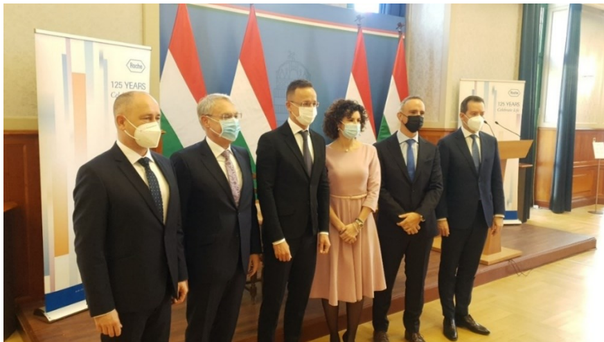
Szijjártó Péter 2021. december 3-án a Roche-sal kötött partnerségi megállapodás ünnepélyes aláírásánál

A Roche és a Novartis svájci vállalatok globálisan is ágazatuk leginnovatívabb konzernjei közé tartoznak. A bázeli cégek innovativitásukat többek között a különböző kutatási intézményekkel folytatott világméretű együttműködésből merítik. Éppen ezért a Roche és a Novartis Magyarországon is hatékony együttműködést folytat különféle egyetemi klinikákkal. Ebben az évben ezeket a Semmelweis Orvostudományi Egyetemmel (SOTE) kötött stratégiai partnerségi megállapodás révén új szintre emelték. Március 21-én a SOTE, az Innovációs és Technológiai Minisztérium (ITM) és a Novartis képviselői egy három pilléren nyugvó partnerségi megállapodást írtak alá. A kutatási együttműködés keretében az egyetem hozzájárulást kap ezen a területen a klinikai kutatásokhoz és a digitális innovációkhoz. A sejt- és génterápiában pedig vezető szerepet kíván elérni, hogy Magyarország a spinális izomatófia (SMA) elleni terápiák élvonalává váljon. Ezen túlmenően az egyetem a Novartis-szal együttműködve szembetegségek kezelésére szolgáló központot hoz létre. Az együttműködés harmadik elemeként a projektpartnerek egészségprogramot hívnak életre, melynek célja, hogy a Magyarországon gyakori szív- és keringési megbetegedéseket mesterséges intelligencia segítségével gyógyítsa. Az innovatív megközelítés az első három évben 50.000 beteget ér majd el és innovatív adatelemzés, mesterséges intelligencia és automatizált tanulás révén új megelőzési és kezelési módszereket fejleszt ki.