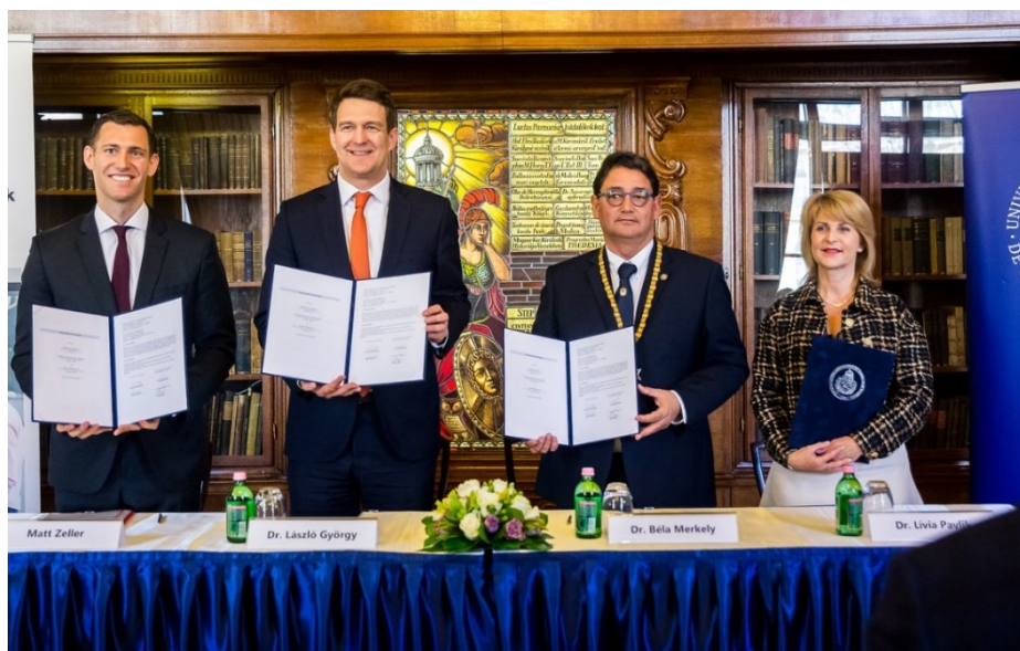
Novartis unterzeichnete das Abkommen mit dem ITM und der SOTE im Dezember 2021

Roche hatte bereits im Dezember 2021 ein strategisches Partnerschaftsabkommen mit der ungarischen Regierung abgeschlossen und dem ungarischen Gesundheitssystem eine Software gestiftet, welche den Patientenweg von Krebskranken digital begleiten und effizient organisieren soll. Am 18. Mai 2022 schloss das Unternehmen darüber hinaus ein Partnerschaftsabkommen mit der SOTE ab, welches sich auf Onkologie, Hämatologie, Immunologie, Neurologie und Ophthalmologie erstreckt. Wichtige Elemente sind dabei die Unterstützung von Bildung, der Austausch internationaler Erfahrungen und die Entwicklung nationaler Praktiken. Durch personalisierte medizinische Betreuung, wertbasierte Gesundheitsversorgung und datengesteuerte Entscheidungsfindung soll die Versorgung im Gesundheitswesen weiterentwickelt und auf eine nachhaltige und auf Patienten fokussierende Bahn gelenkt werden. In Zusammenarbeit mit den beiden Pharmaunternehmen und Swisscham Hungary möchte auch die Botschaft neue Akzente in der