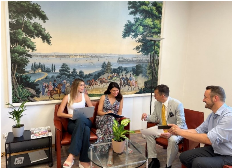
Das Redaktionsteam bei der Arbeit

Im Juli 2021 rief die Botschaft ihre Facebook-Seite ins Leben, um der Schweizer Kolonie in Ungarn, den in Ungarn ansässigen Schweizer Unternehmen und der Handelskammer, Kunstschaffenden sowie an Ungarn und der Schweiz interessierten Personen den direkten Austausch zu vereinfachen und Einblicke in die Tätigkeiten der Botschaft zu ermöglichen. Unser fünfköpfiges Redaktionsteam mit Mitarbeitenden aus den politischen, wirtschaftlichen, rechtlichen und kulturellen Bereichen der Botschaft trifft sich anlässlich der Redaktionssitzung einmal pro Woche zum gemeinsamen Brainstorming. Ein Jahr nach der Lancierung zählt unsere Facebook-Seite bereits über 640 aktive Mitglieder und nahezu täglich kommen neue Mitglieder hinzu. Wir bedanken uns an dieser Stelle von ganzem Herzen für das Interesse, eure Unterstützung, jeden Like, Share, Kommentar, Bewertung und natürlich jede Nachricht von euch. Dass wir mit auf Facebook eine solch hohe Reichweite erzielen konnten, hat uns dazu veranlasst, bald auch noch Instagram in unser Portfolio aufzunehmen.