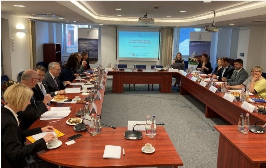
Die schweizerische und die ungarische Verhandlungsdelegation

Berufsbildung, Forschung und Innovation, KMU-Finanzierung, Bekämpfung von Menschenhandel, Energieeffizienz und erneuerbare Energien, Wasseraufbereitung, Gesundheits- und soziale Versorgung sowie Integration der Roma-Minderheit gemeinsam mit der im für die EU-Entwicklungen verantwortlichen Staatssekretariat tätigen Nationalen Koordinationseinheit (NCU) umgesetzt. Sämtliche Programmbereiche werden auf partnerschaftlicher Basis und unter Einbeziehung der Zivilgesellschaft verwirklicht.