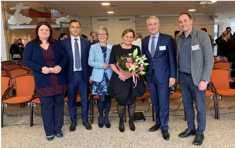
Vertreterinnen und Vertreter der deutschsprachigen Botschaften und der Bürgermeister von Debrecen

Es gibt viele wunderbare Sachen im Leben. Eines davon ist, wenn man sich in einer Fremdsprache verständigen und unterhalten kann. Die Botschaften Deutschlands, Österreichs und der Schweiz sowie viele weitere deutschsprachige Institutionen und Initiativen aus Kultur und Wirtschaft haben sich zum Ziel gesetzt, noch mehr Menschen in Ungarn für die deutsche Sprache zu begeistern. Das Wunderbar Festival, die erste Woche der deutschen Sprache, fand zwischen dem 28. März und dem 2. April 2022 mit zahlreichen Veranstaltungen in ganz Ungarn statt. Botschafter Paroz nahm unter anderem auch an der Schlussveranstaltung des Wunderbar Festivals in Debrecen teil. Nach dem Kulturprogramm hatten die Teilnehmenden auch die Möglichkeit zu vielfältigen Austauschen mit Personen aus den Bereichen Diplomatie, Wirtschaft, Bildung und Kultur.