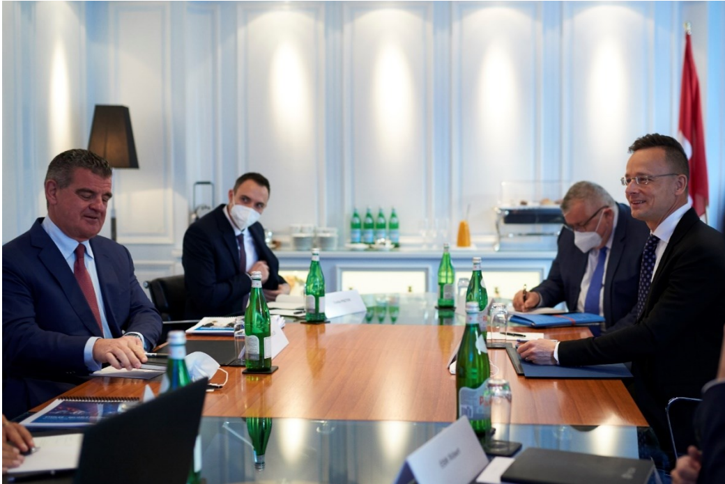
A Stadler Rail vezetője, Peter Spuhler Szijjártó Péter miniszter úrral Bernben

kapcsolatok, Magyarország soron következő elnöksége az Európa Tanács Miniszteri Bizottságában, valamint a Covid-19 világjárvány társadalompolitikai és gazdasági következményei álltak. A munkamegbeszélés során európai politikai kérdésekkel is foglalkoztak. Ignazio Cassis szövetségi tanácsos tájékoztatta kollégáját a Svájc és az Európai Unió közötti kapcsolatokról. A találkozón gratulált Magyarország soron következő elnökségéhez az Európa Tanács Miniszteri Bizottságában. Felhívta a figyelmet a svájci külpolitika olyan központi elemeire is, mint az emberi jogok, a demokrácia és a jogállamiság megerősítése, valamint a kisebbségek védelme.