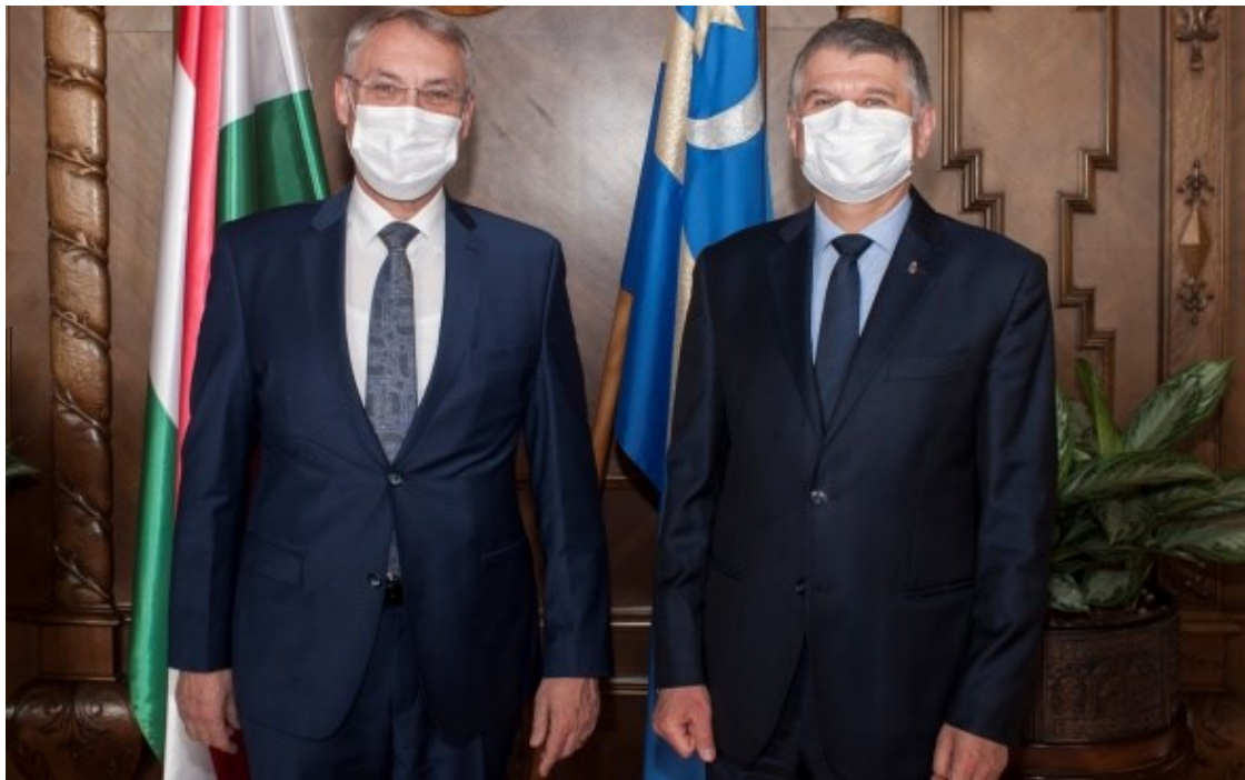
Botschafter Paroz mit Parlamentspräsidenten Kövér

Anlässlich eines Besuchs des Präsidenten des ungarischen Parlaments in der Schweiz im 2019 wurde die Gründung einer schweizerisch-ungarischen parlamentarischen Freundschaftsgruppe geplant. Diese ist mittlerweile realisiert worden. Parlamentspräsident Kövér freut sich auf den baldigen ersten Besuch dieser Freundschaftsgruppe in Budapest.