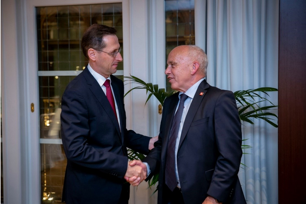
Minister Mihály Varga mit Bundesrat Ueli Maurer

Neben den offiziellen Gesprächsthemen wurden auch persönliche Geschichten ausgetauscht. So erzählte Bundesrat Maurer, wie er als sechsjähriger Junge seine Mutter beobachtete, wie sie mit Spannung die Neuigkeiten zum ungarischen Volksaufstand 1956 im Radio verfolgte. Bis zu diesem prägenden Vorfall sei sich Ueli Maurer nicht bewusst gewesen, dass es neben der Schweiz auch andere Länder gegeben habe. Ungarn war somit das erste Land, welches der Bundesrat neben der Schweiz aktiv wahrnahm.