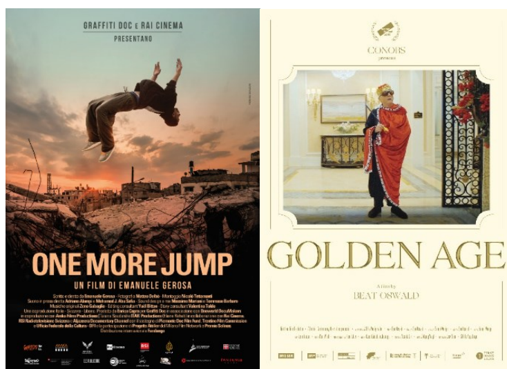
A svájci filmek plakátjai

A Budapest International Documentary Festival 30 kiváló egészestés nemzetközi versenyfilmmel és 8 magyar diák versenyfilmmel várta a közönséget 10 napon keresztül március 1. és 10. között. A világ minden részéről érkezett filmek között két svájci filmet, A hegy szelleme (Eliza Kubarska) és a Még egy ugrás (Emanuele Gerosa) című alkotást is megnézhattük online Magyarország egész területén, valamint közel 100 beszélgetéshez csatlakozhattunk online. Örömről szolgál, hogy idén is támogathattuk a fesztivált és gratulálunk a szervezőknek a sikerhez!