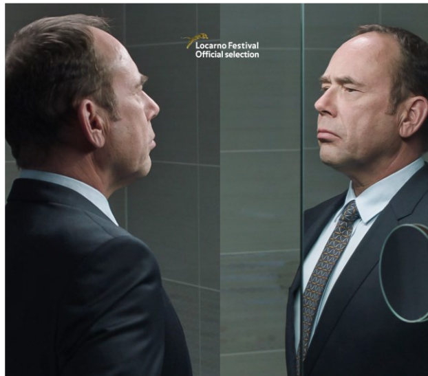
Scène du film Ceux qui travaillent

Dans le contexte des Journées du cinéma francophone, huit longs métrages ont été projetés pendant dix jours, du 22 avril au 2 mai, que le public hongrois a pu voir pour la première fois. En outre, une série de programmes d'accompagnement a été organisée conjointement avec le théâtre national de cinéma d'Uránia. Une sélection de meilleur du cinéma francophone a été présentée au public hongrois par les ambassades francophones en Hongrie.