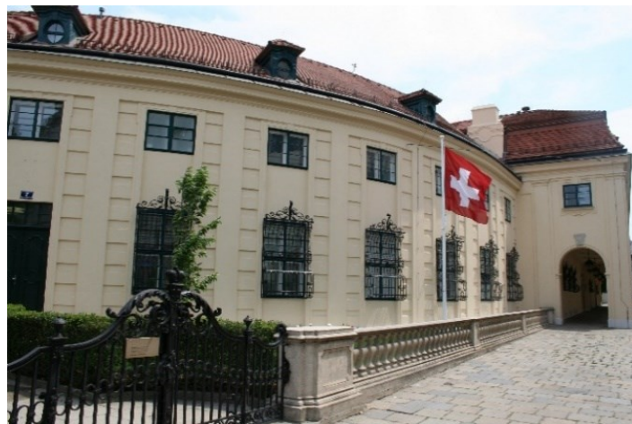
Regionales Konsularcenter Wien RKC Wien

Weitere Informationen zum Thema: Website des Regionalen Konsularcenters Wien