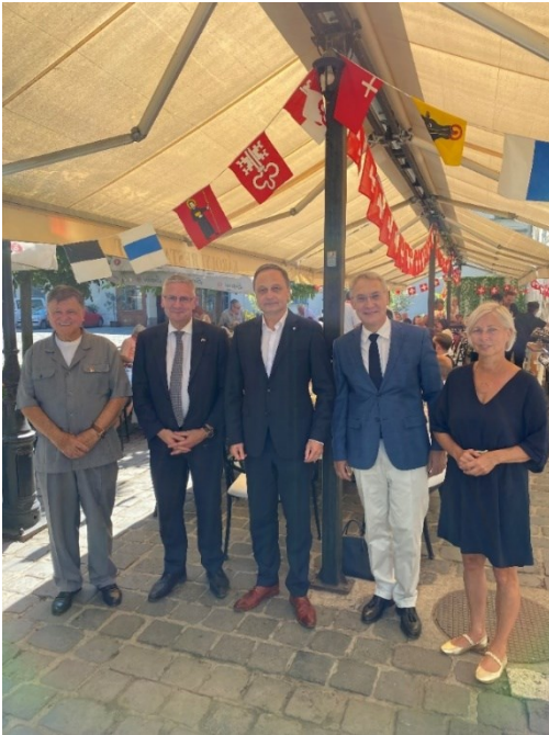
Botschafter Paroz bei der SVU-Feierlichkeit