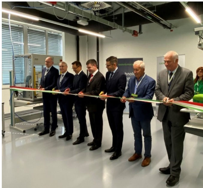
Feierliche Einweihung des Sensirion-Werkes / Foto: Schweizerische Botschaft

Nur eine Woche später wurde Ende September im regionalen Technologiepark von Debrecen das für die ungarische Tochter der Sensirion AG errichtete Werk eingeweiht. Die 10 Mio. Euro Investition wurde von der Szinorg Gruppe und der Xanga Gruppe gemeinsam realisiert und dem Schweizer Investor schlüsselfertig zur Miete überreicht. Beim Bau der Produktionsstätte spielte die Nachhaltigkeit eine überaus wichtige Rolle, weshalb das Werk in Debrecen – ähnlich wie das schweizerische Stammwerk in Stäfa (ZH) – so konzipiert wurde, dass es ohne Einsatz fossiler Brennstoffe auskommt. Auch die energiesparende LED-Beleuchtung und der Umgang mit wiederverwertbarem Verpackungsmaterial widerspiegelt die auf Nachhaltigkeit ausgerichtete Unternehmensphilosophie der Sensirion AG. Da der Ausbau der Produktionskapazitäten eine strategische Erweiterung für das Mutterhaus darstellt, führte diese Investition zu keiner Stellenverlagerung aus der Schweiz. Darüber hinaus entschied Sensirion, ein Entwicklerteam für die Sensirion Automotive Solutions in Debrecen zu stationieren, welches eigenständig Projekte in der Automobilbranche durchzuführen in der Lage ist.