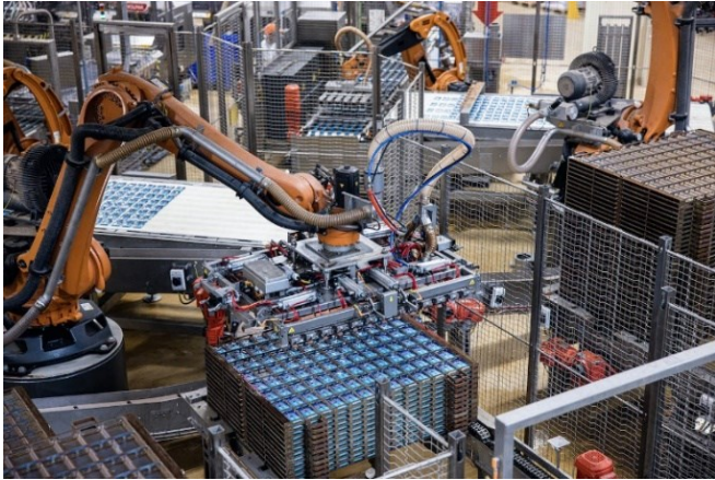
Roboter bei der Produktion von Tiernahrung

Auch Westungarn kann auf den weiteren Ausbau der schweizerischen Wirtschaftspräsenz zählen, denn der schweizerische Lebensmittelkonzern Nestlé führt den Ausbau seiner Tiernahrungsfabrik fort und investiert abermals 35 Mrd. HUF (100 Mio. EUR) in seinen Standort Bük. Neben einer hohen Automatisierung werden dabei auch 120 zusätzliche Stellen geschaffen. Erst vor einem Jahr hatte Nestlé eine 50 Mrd. Forint (rund 138 Mio. Euro) umfassende Investition angekündigt, welche 160 neue Arbeitsplätze schaffen soll. Nun entschied der Lebensmittelkonzern, diese Investition weiter aufzustocken. Bis Ende 2022 wird das Werk in der