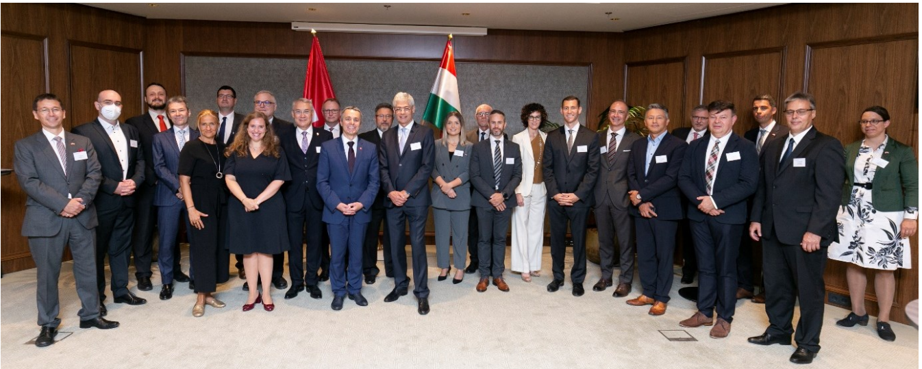
Bundesrat Ignazio Cassis traf sich mit Vertreterinnen und Vertretern der schweizerischen Business Community