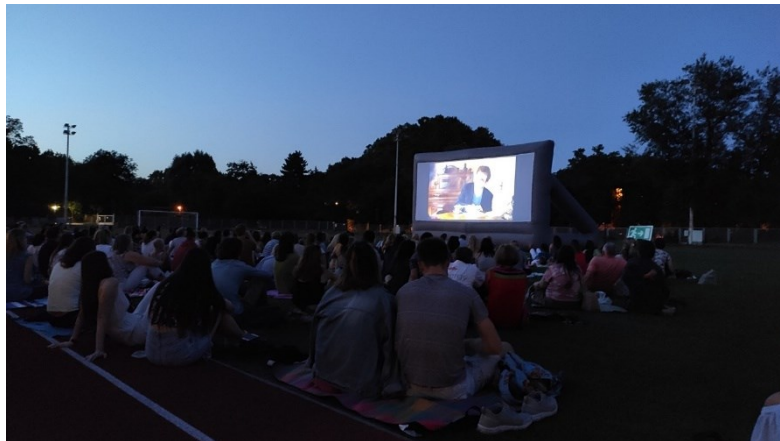
Der Film Wolkenbruch am Margareteninsel

Die in Ungarn ansässige Gemeinschaft der europäischen Kulturinstitute, EUNIC Hungary, hat zum ersten Mal ein Open Air-Filmfestival mit dem Namen Mozisziget auf die Beine gestellt. Das entwickelte Konzept war sehr erfolgreich. Zwischen dem 7. und 22. August wurden die besten Filme aus 16 Ländern im Athletikzentrum auf der Margareteninsel unter freiem Himmel präsentiert. Die Kooperation zwischen den Kulturinstituten, Budapest Film und der Budapester Stadtverwaltung, welche das Athletikzentrum zur Verfügung gestellt hat, verlief ausgezeichnet. Das Wetter hat toll mitgespielt, an keinem der Abende gab es Regen. Der schweizerische Beitrag Wolkenbruch vermochte das Publikum zu begeistern.