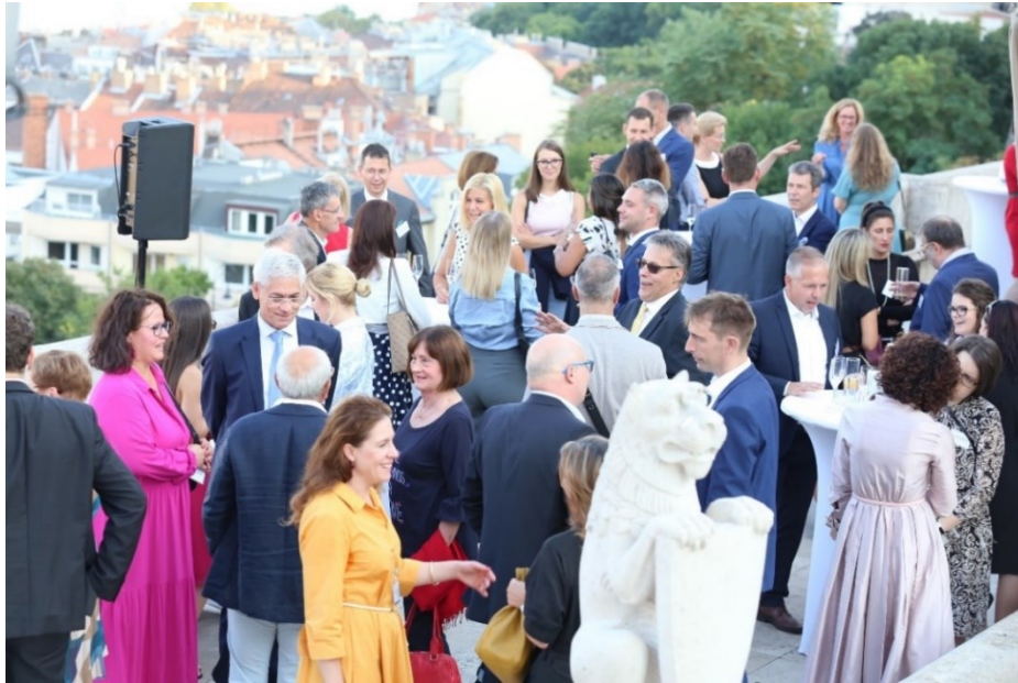
Swisscham Networking Anlass auf der Fischerbastei