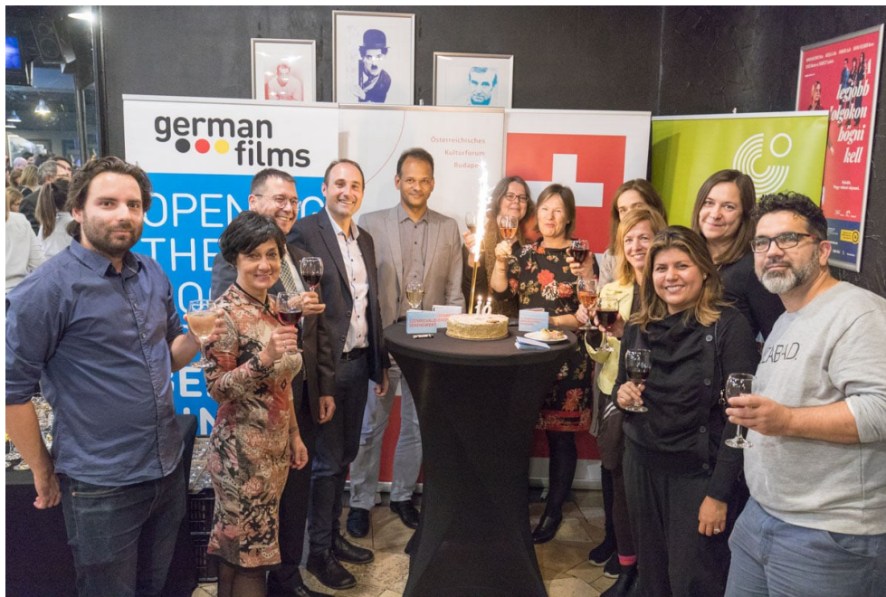
Das Filmfestival Sehenswert feierte bereits sein 10. Jubiläum

Ebenfalls am 7. Oktober öffnete Art Market Budapest, mittlerweile eine der bedeutendsten Messen Mitteleuropas für zeitgenössische Kunst, dem Publikum seine Türen. Die schweizerische Galerie a-Space aus Rheinfelden war bereits zum 6. Mal an der Messe vertreten. Mit ihrem neuen Projekt SEED 2.0 - ART FOR A SUSTAINABLE FUTURE zogen sie viele Interessierte an. Das Projekt behandelt das vielfältige und breit diskutierte Thema der Nachhaltigkeit und verbindet Kunst, Wirtschaft, Politik und Innovation miteinander. Zeitgenössische Künstlerinnen und Künstler aus aller Welt stehen dabei in einem ständigen Dialog und fokussieren auf Fragen punkto Nachhaltigkeit, die ihre Arbeit auf vielfältige Art und Weise beeinflussen. Nachdem das Projekt im Bálna in Budapest Premiere feierte, werden die Arbeiten in der Folge auch in Polen, Japan, Taiwan und in der Schweiz zu sehen sein.