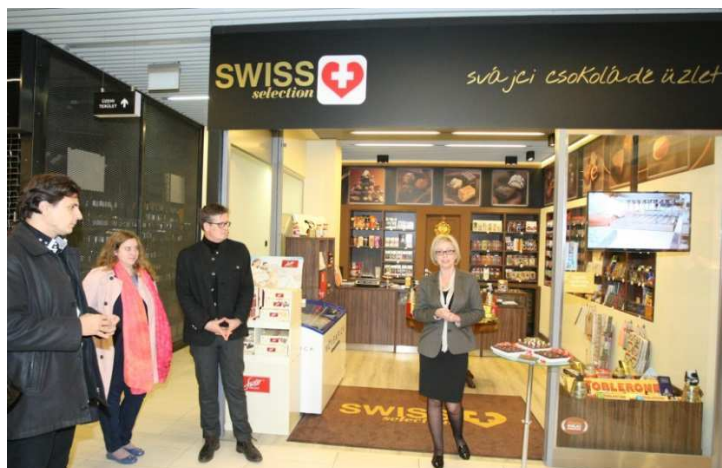
Swiss Selection, a „finom bolt”