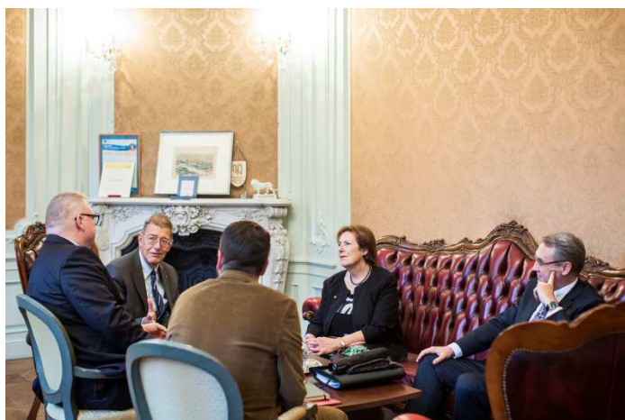
Egerszegi-Obrist tanácsos asszony az Andrassy Egyetem rektorával tárgyal

asszony, a svájci parlament felsőházának tagja beszédében hangsúlyozta, hogy a "svájci pontosság és a rendszeret", valamint a "magyar szívéllyesség és spontaneitás", ahogyan ő azt a házasságában is megélte, jó alapot nyújtanak a népek közötti párbeszédhez. Kölsönös megértésből és kölsönös szimpátiából kiindulva a két ország kapcsolatai az idők folyamán kitűnően fejlődtek. Ugyanakkor az államok viszonya nemcsak gazdasági és politikai alapokon nyugszik, hanem az emberi találkozások is nagymértékben befolyásolják. Az egész napos konferencia átfogó képet adott a közönségnek a svájci-magyar kapcsolatokról történelmi, gazdasági, politikai és az emberi kapcsolatok szemszögéből.