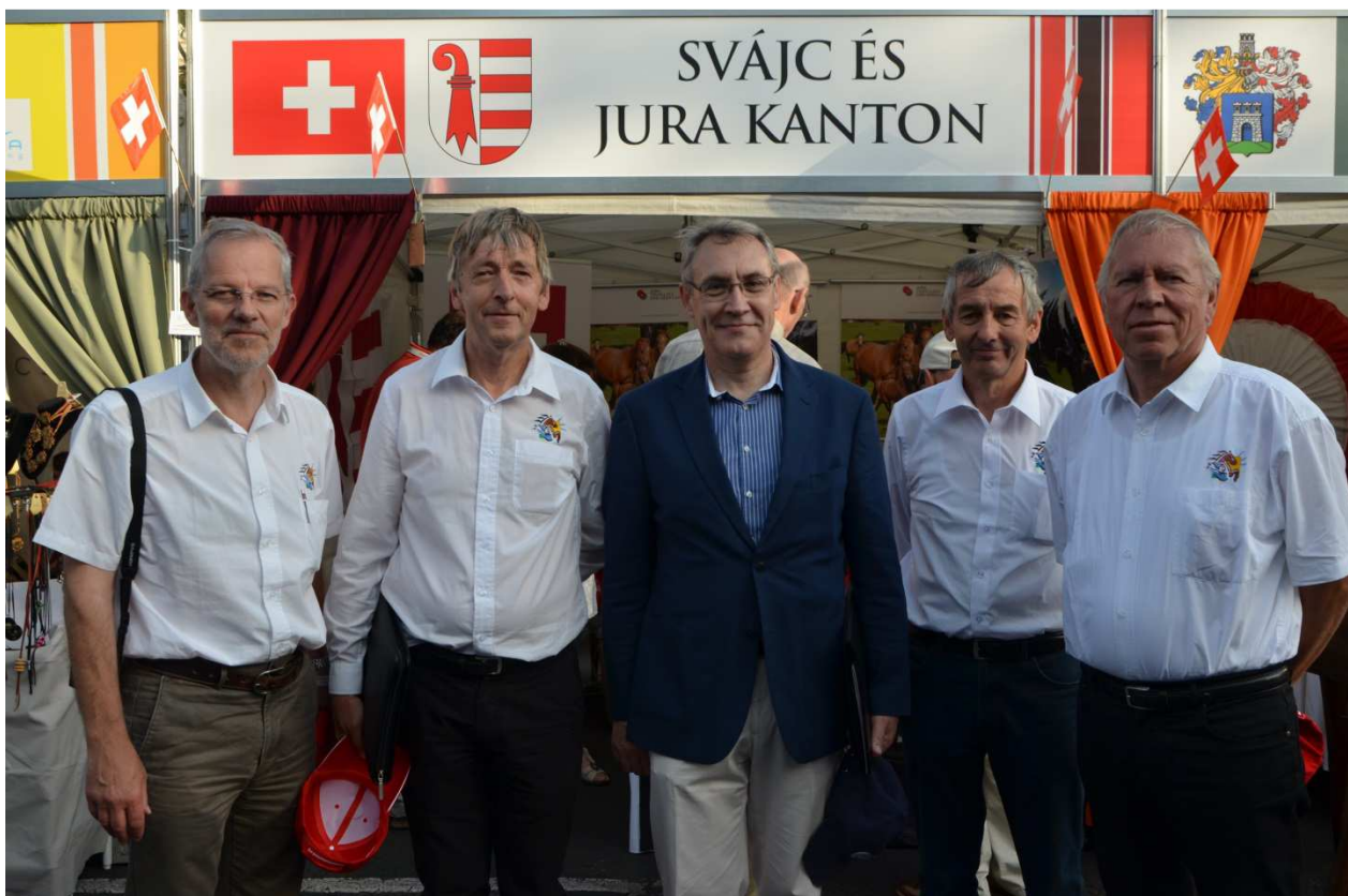
A Marché-Concours delegációja Saignelégier-ből Paroz nagykövet úrral

A Svájc Turizmus és a Jura Turizmus Svájc Nagykövetségével közös standot nyitott az Andrassy úton. Sok látogatónak mutatták be a Jurában honos freiburgi lovat és a Jura kantonba látogatókra váró szabadidős lehetőségeket. Bizonyára sokan csodálkoztak a sok svájci sapka láttán a Hősök terén, a svájci standon több mint ötezer sapkát osztottunk ki a látogatóknak!