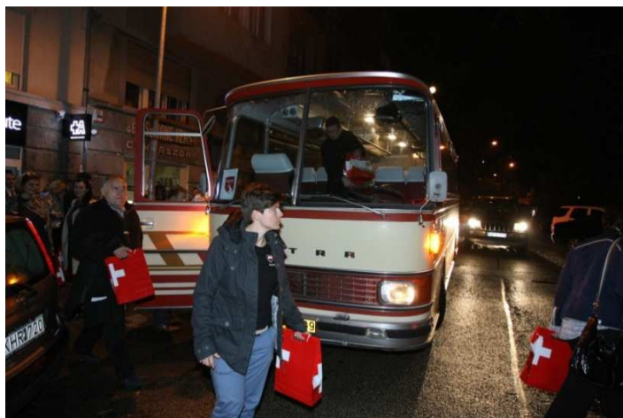
Úton a következő svájci céghez