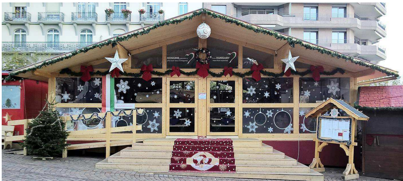
A magyar csárda Montreux-ben

Leginkább az esti hangulat tett mély benyomást a látogatókra: a sok fény, az égő fáklyák és meleg fényű gyertyák meheített léghőrt teremtettek a karácsonyt váró időszakban.