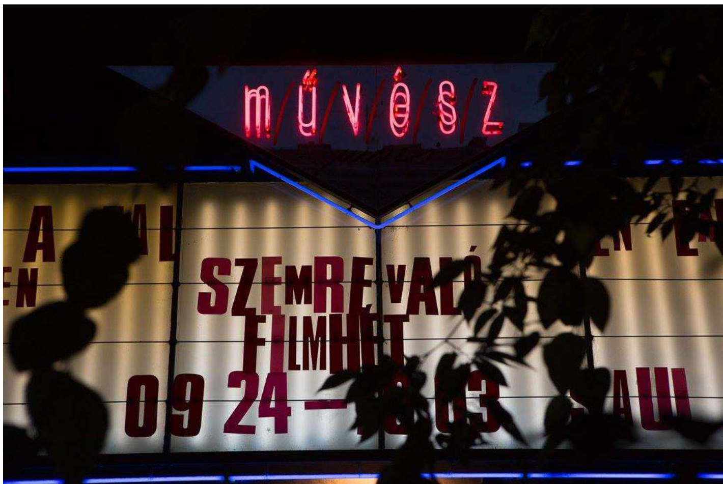
A Szemrevaló budapesti helyszíne: a Művész mozi

6 film Rainer Werner Fassbinder munkásságát mutatta be, aki 2015-ben lett volna 70 éves. A program a migráció, a másság és a „Talajt veszített fiatalok” témakörök köré csoportosultak. A fesztivál csaknem 3500 nézőt vonzott. A fesztiválon négy svájci filmet mutattunk be, ezek közül a „Kör” és az „Új világ” voltak a nézők kedven svájci filmjei. A nagy sikerre való tekintettel, jövőre is megrendezzük a fesztivált, így már most lefoglalhatja naptárában a szeptember végét!