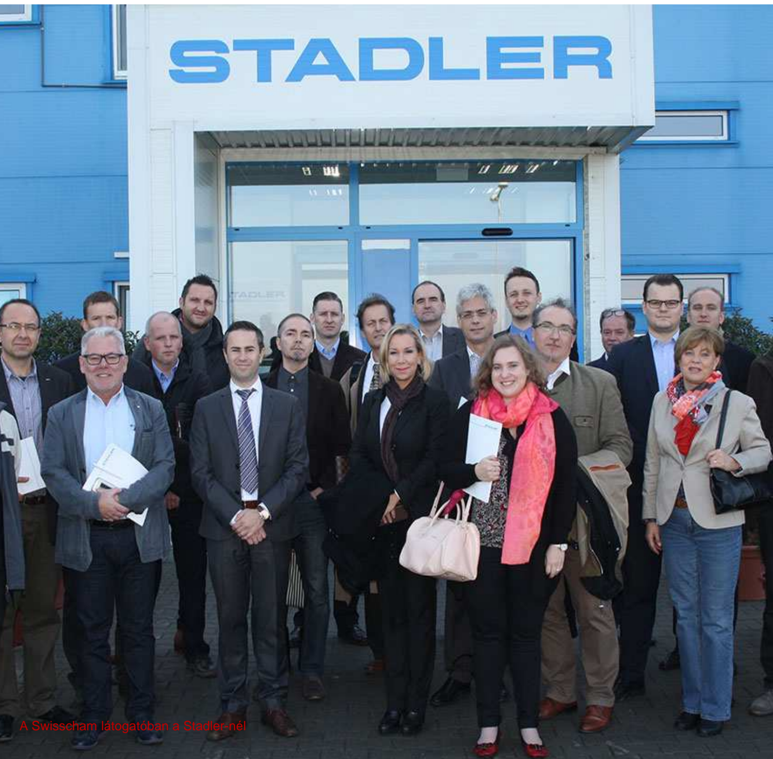
A Swisscham látogatóban a Stadler-nél