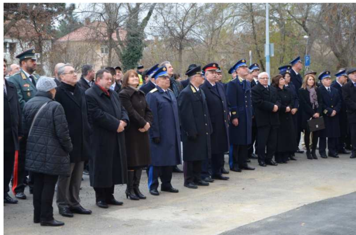
A felújított rendőrségi épület átadási ünnepségén

Az épületek mára új, költséghatékony fűtési, víz- és szennyvíz-, valamint elektromos rendszert kaptak, amelyek megfelelnek az EU energiahatékonysági követelményeinek és szabványainak. Továbbá modern tűzvédelmi rendszerek kialakítása is megtörtént, emellett pedig a megújuló energiafelhasználás is előtérbe került. A projekt így hozzájárult a rendőrségi dolgozók munkakörülményeinek, illetve a menedékkérők elhelyezési körülményeinek javításához.