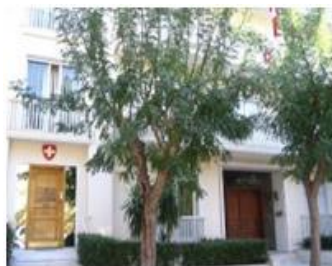
Ambassade de Suisse à Athènes

J'ai le plaisir de vous proposer la quatrième livraison de notre chronique. Le début de l'année 2014 fut aussi celui de la présidence grecque de l'Union européenne. Et c'est dans le cadre de cette présidence que la Conseillère fédérale Eveline Widmer-Schlumpf a rendu une visite, aussi utile que remarquée, à son homologue, le ministre des finances Yannis Stournaras le 4 février dernier. Quelques jours plus tard, les citoyennes et citoyens suisses ont créé la surprise en acceptant de justesse l'initiative constitutionnelle « contre l'immigration massive ». Le Conseil Fédéral a d'ores et déjà commencé d'intenses consultations, en Suisse, à Bruxelles et dans les capitales de l'UE. Il a 3 ans pour élaborer une loi basée sur l'initiative.