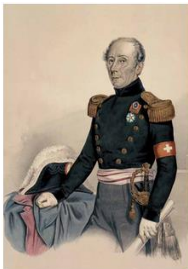
Le général Guillaume-Henri Dufour (1787-1875)