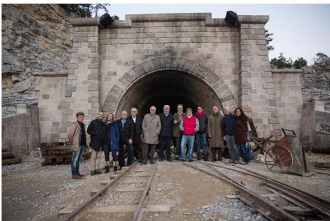
Ortstermin im „tschechischen Göschenen“ mit Verantwortlichen von SRF und ZDF. / Rencontre à la „Göschenen tchèque“ avec des responsables de la SRF et de la ZDF.

Der grosse zweiteilige Film soll im Spätherbst 2016 zeitgerecht mit der Einführung des Winterfahrplans der SBB auf die schweizerischen Bildschirme kommen.