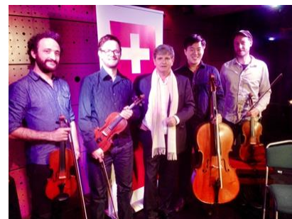
Botschafter M.-A. Antonietti mit dem Kaleidoscope String Quartet bei der Eröffnung des Swiss Jazz 2015.

Le duo BLUE 2147, qui a joué à Prague et à Pilsen, est un projet de deux musiciens progressistes. Composé d'un pianiste et d'un batteur, BLUE 2147 associe dans sa musique deux caractéristiques techniques qui fournissent à la fois des sons très bariolés mais aussi très rythmiques.