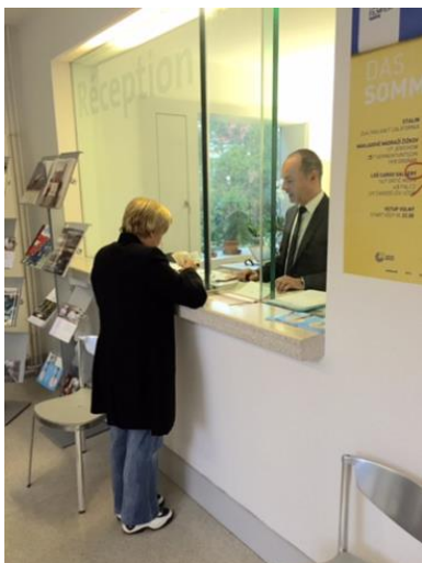
Vertreter des Regionalen Konsularcenters im Einsatz. Un représentant du centre consulaire régional en service.

Neben der Tschechischen Republik nimmt Wien die konsularischen Dienstleistungen auch noch für sechs weitere Staaten wahr: Slowakei, Ungarn, Bosnien und Herzegowina, Kroatien, Slowenien und natürlich für Österreich. Die konsularischen Mitarbeiter reisen daher auch in diese Länder. Der nächste Besuch in Prag ist im Frühsommer 2016 geplant.