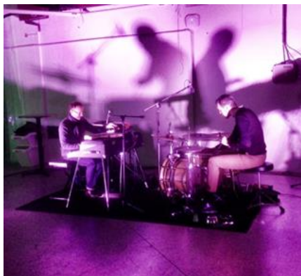
Das Duo BLUE 2147 im Pilsner Kulturraum. Le duo BLUE 2147 à l'espace culturel de Pilsen.

Die Schweizerische Botschaft hat in Zusammenarbeit mit dem JazzDock im Oktober und November eine erfrischend moderne Serie von Konzerten unter dem Namen SWISS JAZZ 2015 im JazzDock organisiert. Ein Konzert fand im Pilsner Kulturraum statt. Die vier Schweizer Gruppen verbindet sowohl der progressive Zugang zu Musik, als auch das originelle Schaffen auf höchstem instrumentalem Niveau.