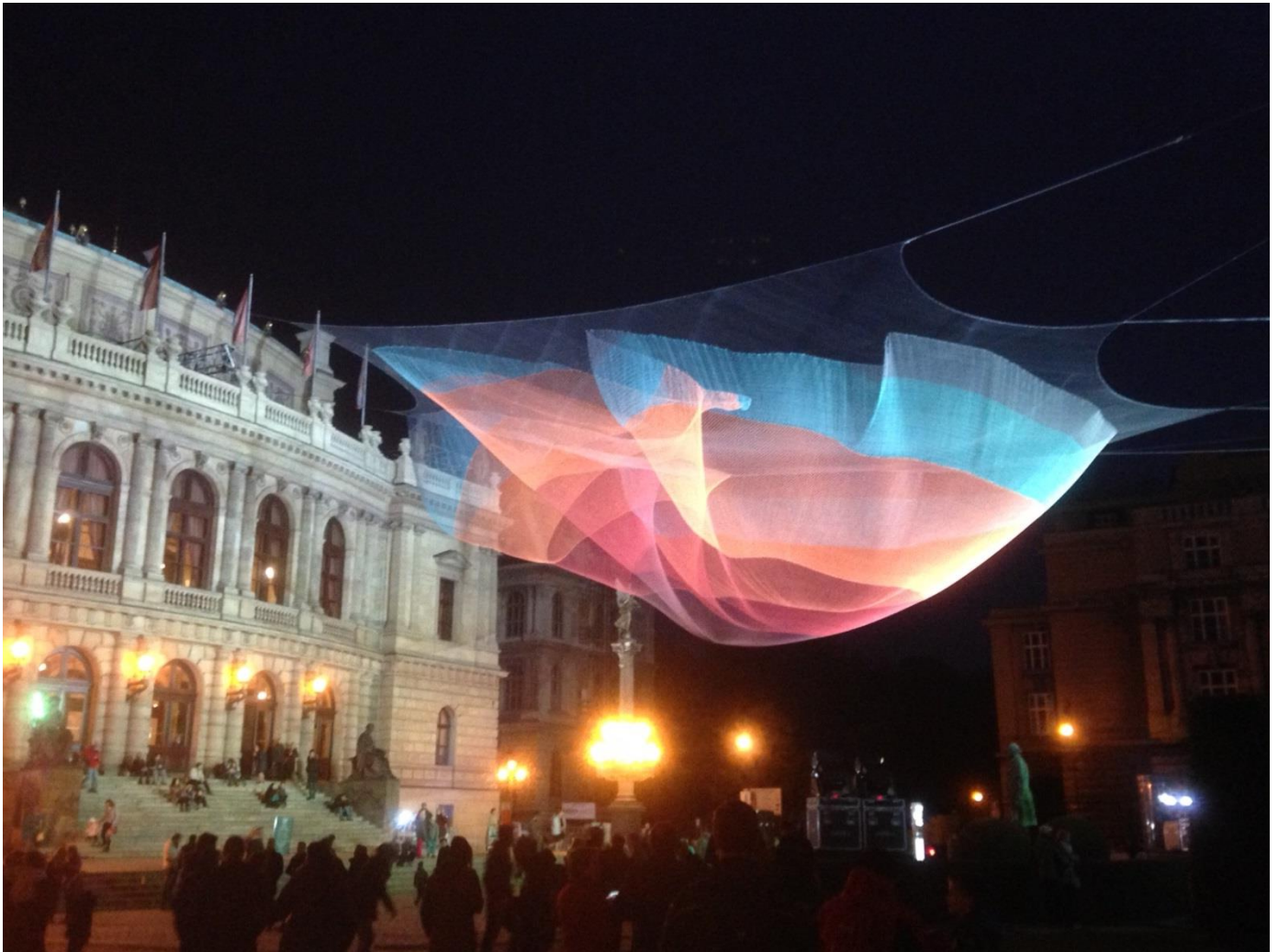
Signal-Festival 2015 in Prag Signal-Festival 2015 à Prague