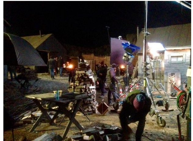
Das Filmset von „Gothard“ bei Nacht. Le plateau de tournage nocturne de „Gothard“.