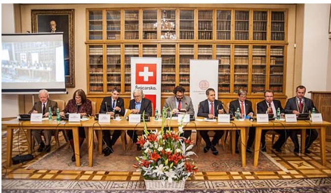
Teilnehmer der Paneldiskussion „Direkte Demokratie“. Les participants à la table ronde „démocratie directe“.

Zum Abschluss lud die Botschaft zu einer Verköstigung mit Schweizer Käse, diversen Fleischplatten, Salaten und guten Schweizer Weinen ein. Um den Abend mit den Worten von Herrn Gross zu beschreiben: „Eine gute Diskussion – sie ist die Seele der direkten Demokratie – misst sich daran, dass dabei alle gescheitert werden und dazulernen“.