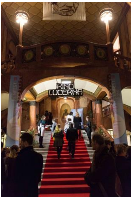
Eröffnung des 10. Filmfests im Kino Lucerna. Inauguration du 10ème « Filmfest » au cinéma Lucerna.

Vom 21. bis 25. Oktober fand die 10. Ausgabe des Filmfestes der deutschsprachigen Filme in Prag statt. Es ist dies ein Gemeinschaftsprojekt des Goethe Instituts, des Österreichischen Kulturforums und der Schweizerischen Botschaft. Das runde Jubiläum bot den Festivalbesuchern ein reichhaltiges Menu. Das Programm umfasste einerseits aktuelles Filmschaffen aus der Schweiz, Deutschland und Österreich, andererseits aber auch bekannte Klassiker. Neben Prag gastierte das Filmfest wieder in Brünn und zum ersten Mal in Pilsen.