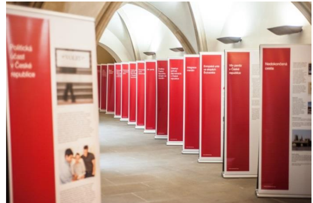
Das Karolinum im Zeichen der „Direkten Demokratie“. Le Carolinum sous le signe de la „démocratie directe“.