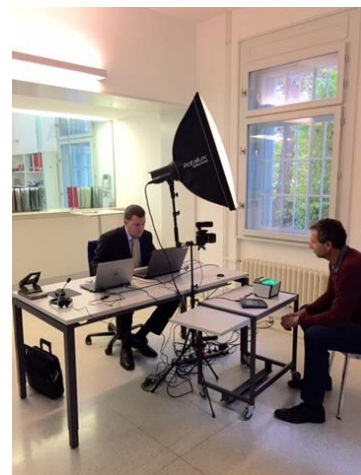
Die mobile Dienstleistung ermöglicht die Aufnahmen von Fotos und den biometrischen Daten vor Ort in Prag.

Depuis 2011, les prestations du service consulaire (établissement de passeports, de cartes d'identité, changements d'état civil, immatriculation etc.) ne sont plus fournies par l'Ambassade de Suisse à Prague mais par le centre consulaire régional à Vienne. Afin d'éviter que les ressortissants suisses vivant en République Tchèque doivent se rendre à Vienne, certaines prestations consulaires traditionnelles sont fournies sur place par le « consulat mobile ». Deux fois par an, les collègues de Vienne se rendent à Prague et procèdent directement à l'Ambassade à la saisie des photos et des données biométriques en vue de l'établissement de passeports et de cartes d'identité. Afin que tout se déroule sans accroc, une bonne planification et préparation sont nécessaires. Les demandes ne peuvent être traitées que si les personnes se sont préalablement inscrites, ont rempli les formulaires requis et ont reçu une confirmation du centre consulaire.