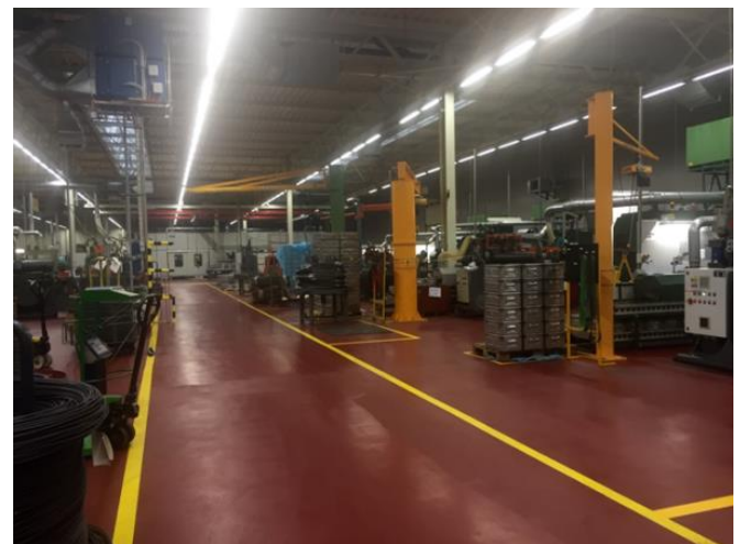
Die Produktionsstätte der Schweizer Firma DGS. Le site de production de l'entreprise suisse DGS.

Trois entreprises suisses modernes et très bien positionnées sont implantées aux alentours de Liberec: SFS, DGS et EMS-EFTEC. La palette de production va de composants spéciaux pour l'industrie du bâtiment jusqu'aux pièces moulées ou de la colle pour l'industrie automobile mondiale. Des nouveaux investissements sont prévus et devraient renforcer durant les prochaines années la position de la marque Suisse.