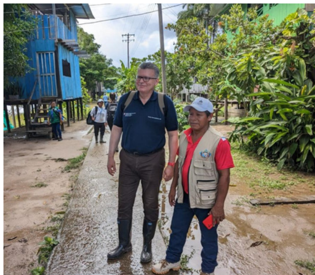
El Embajador de Suiza, Eric Mayoraz, durante su visita al Amazonas

Espero que esta nueva edición de Newsletter llame toda su atención y les guste. Quedamos por supuesto a su disposición si quieren saber más sobre nuestras actividades en Colombia tanto en la construcción de paz como en los otros ámbitos de acción en el país.