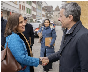
Encuentro entre la entonces Ministra de Relaciones Exteriores, Antonia Urrejola, y el Consejero federal, Ignazio Cassis

El Consejero federal de Suiza, Ignazio Cassis, recibió a la entonces Canciller chilena Antonia Urrejola durante su paso por Suiza, en un intercambio bilateral en la ciudad de Murten. Las autoridades abordaron las relaciones económicas bilaterales, y la cooperación medioambiental y en foros multilaterales.