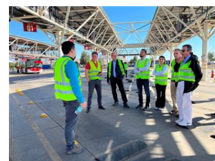
Visita a una planta de transporte público de Santiago

Durante su viaje, el Ministerio de obras públicas de Chile, le presentó a los Ministerios de medioambiente de Chile, Colombia, México y Perú, los resultados del apoyo de la Cooperación Suiza (COSUDE) en la implementación de filtros de partículas diésel en la maquinaria de construcción en el marco del programa CALAC+. Pueden ver un resumen del programa en este video .