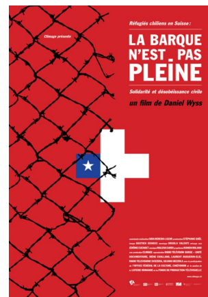
La Barque n'est pas pleine © Daniel Wyss

países europeos tuvieron en este proceso. La película suiza representada será “La Barca no está llena” ( La Barque n'est pas pleine ), una producción del director Daniel Wyss, que aborda la solidaridad del pueblo suizo con los exiliados chilenos.