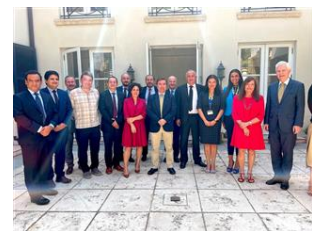
Desayuno de trabajo en la Residencia de Suiza

Con el apoyo del Swiss Business Hub Chile, en la Residencia de Suiza se realizó un desayuno de trabajo para intercambiar sobre la importancia de la confianza y la trazabilidad en la construcción de economías más transparentes. El evento contó con la participación de actores públicos chilenos y de la empresa suiza SICPA , que apoya a Chile con soluciones innovadoras para combatir el comercio ilícito y crear cadenas de producción sostenibles.