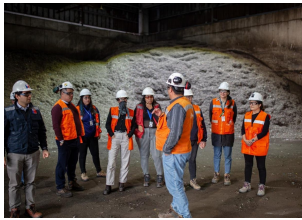
Visita a la planta de tratamiento de residuos de Til-Til

La Embajada y el Municipio de Til-Til fueron los anfitriones de la 3° Mesa Técnica sobre gestión de residuos que se realizó en el marco de un Convenio de colaboración que Suiza mantiene con ocho municipios chilenos. Las ideas compartidas por los participantes, entre los que figuraba un experto suizo en gestión ambiental, servirán de base para generar acciones concretas en economía circular y reciclaje.