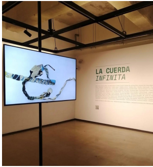
La Cuerda Infinita en Suizspacio