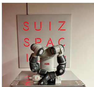
YuMi en la galería Suizspacio, Metro Ñuñoa

En marzo, Suizspacio recibió una visita especial. YuMi, primer el robot colaborativo del mundo de la empresa suiza ABB, estuvo durante 5 días interactuando con los pasajeros de la estación Ñuñoa. A través de juegos como el dominó y el Jenga, YuMi contribuyó a derribar los mitos en torno a la robótica colaborativa. La actividad fue mencionada por noticieros televisados y contó con cientos de visitas. Con el apoyo de Switzerland Global Enterprise se aprovechó de esta oportunidad para invitar a tomadores de decisiones del sector de la robótica y conversar sobre el ecosistema de innovación suizo en este rubro.