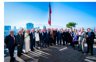
Encuentro del cuerpo diplomático europeo y el Ministro Klaveren

El Embajador Markus Dutly participó de un encuentro en el Ministerio de Relaciones Exteriores de Chile, organizado por el Ministro Alberto Klaveren para conocer al cuerpo diplomático europeo en Chile.