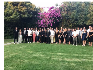
Visita de los estudiantes a la Residencia de Suiza

También fueron recibidos por el Embajador Dutly en la Residencia de Suiza donde aprendieron acerca de las actividades de la Embajada y el Consulado.