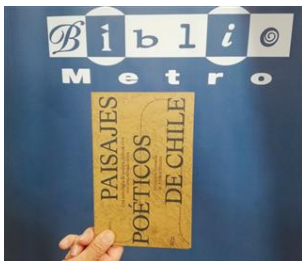
Paisajes Poéticos de Chile

Junto a Metro de Santiago, la Embajada hizo entrega de la antología de poesía "Paisajes Poéticos de Chile" a la red Bibliometro y al Sistema Nacional de Bibliotecas Públicas . Desde ahora, el libro vinculado al proyecto Suizspacio puede ser obtenido gratuitamente en los 25 puntos de Bibliometro de la red de Metro de Santiago, en todas las bibliotecas regionales de Chile, o descargado en este enlace .