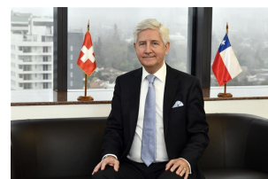
Markus Dutly, Embajador de Suiza en Chile

En 2023, conmemoramos los 31 años de cooperación bilateral con Chile en materia medioambiental; un importante hito que refleja las excelentes relaciones que mantenemos con este país, y que aprovechamos de celebrar durante la visita a Chile