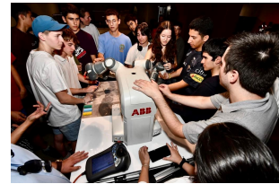
Taller de robótica en Suizspacio

Aprovechando de esta visita, y de la presencia de especialistas en robótica de ABB, estudiantes del electivo de física del Colegio Suizo estuvieron en Suizspacio haciendo talleres de robótica colaborativa.