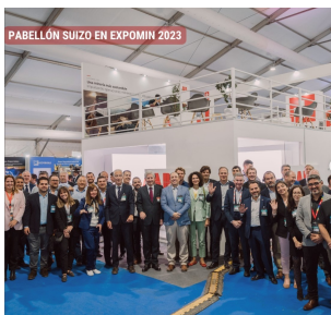
Pabellón suizo en Expomin 2023

Suiza se hizo presente nuevamente en la feria minera más importante de Latinoamérica. En un innovador pabellón suizo de dos pisos, catorce de nuestras empresas presentaron durante cuatro días sus innovaciones tecnológicas, que contribuyen a hacer de la minería una práctica más sostenible. Vean detalles en este video .