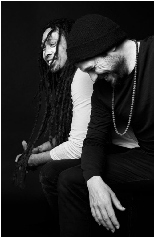
The TWO

Festival des traditions du monde , Sherbrooke, QC