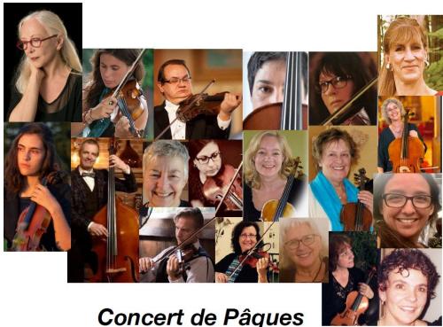
Concert de Pâques