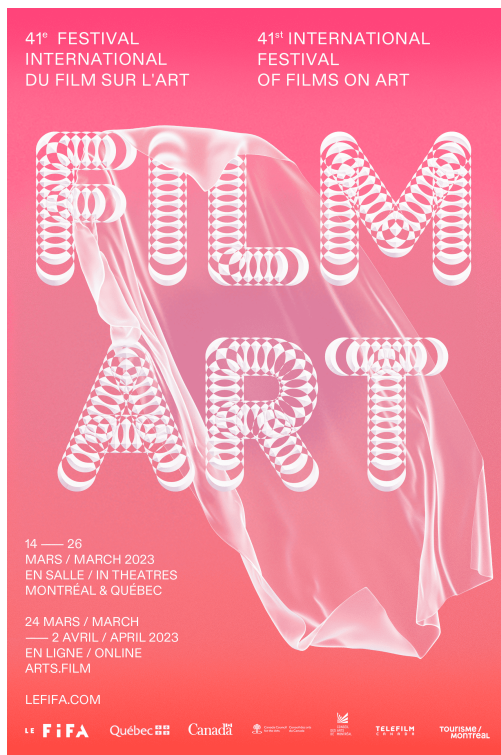
©Affiche de la 41e édition du Festival International du Film sur l'Art (Le FIFA) réalisée par Joanie Brisebois

Vous aimez les films sur l'art? La 41 e édition du Festival International du Film sur l'Art présente cinq (co)productions suisses, en ligne jusqu'au 2 avril 2023: