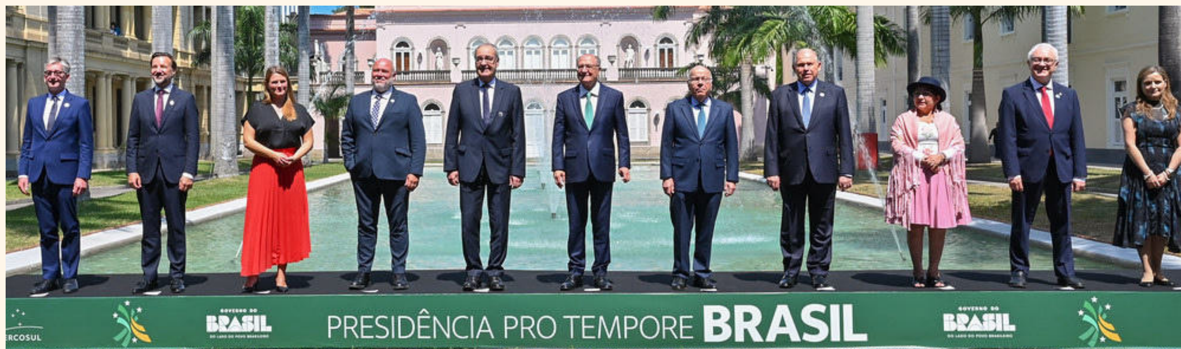
Ministros posam para foto após assinatura do acordo no Palácio do Itamaraty no Rio de Janeiro.