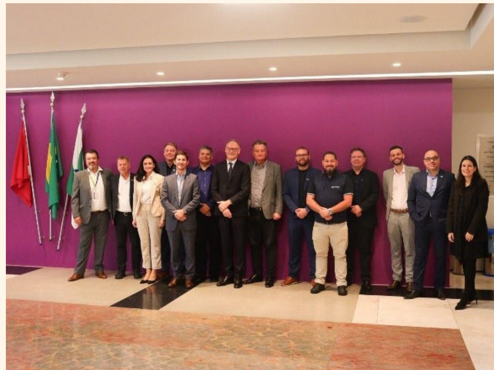
Delegação em viagem a Curitiba de

O Ceará vem se consolidando como um polo estratégico de infraestrutura e transição energética no Brasil, graças à sua posição geográfica privilegiada, ao alto potencial em energias renováveis onshore e offshore e à sua conectividade internacional por meio de cabos submarinos.