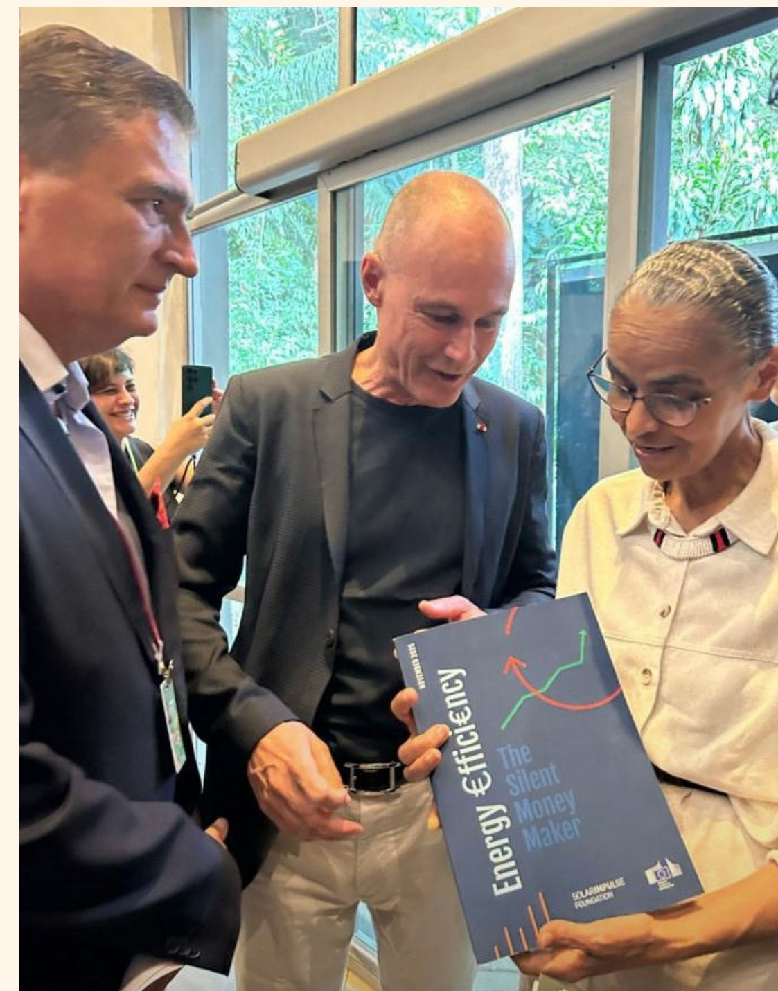
BERTRAND PICCARD., MINISTRA MARINA SILVA E EMBAIADOR HANSPETER MOCK

Em Belém, durante a COP30, o protagonismo suíço tornou-se impossível de ignorar. No coração do Museu Emilio Goeldi — um verdadeiro oásis verde no centro da cidade — a Suíça instalou a Planetary Embassy, um espaço inovador que materializou uma nova forma de diplomacia: sensível, conectada à natureza e aberta ao diálogo entre ciência, cultura, e espiritualidade.