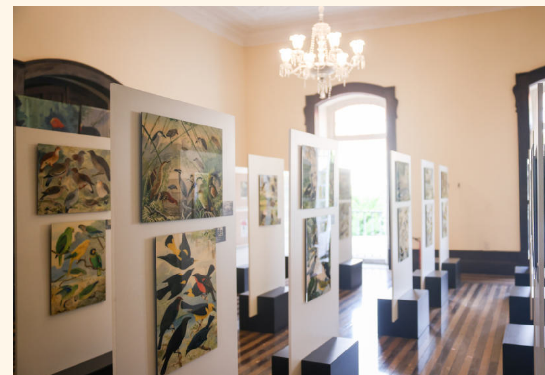
LAYOUT DA EXPOSIÇÃO