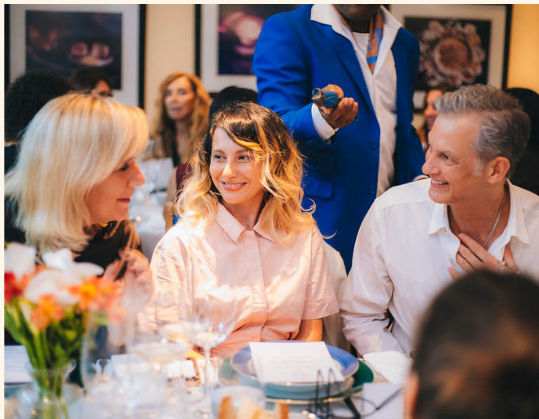
CONVIDADOS DO SWITZERLAND TRAVEL EXPERIENCE