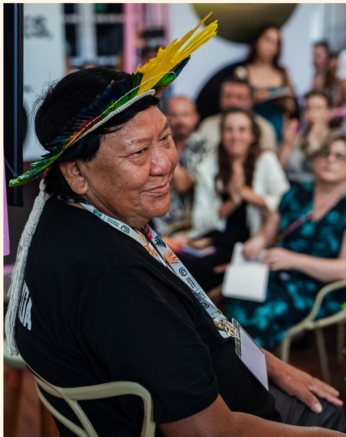
DAVI KOPENAWA

'Anticipating and Shaping Responsible Tech Innovation for Ecosystems', em parceria com o UN Human Rights B-Tech Project e a GESDA, além do lançamento do Planetary Embassy durante a COP30 em Belém. O pavilhão, instalado dentro do Museu Paraense Emílio Goeldi e realizado em parceria com a Presence Switzerland e como parte do programa Road to Belém da Embaixada da Suíça no Brasil, acolheu saberes diversos e reuniu ciência, tecnologia, arte e perspectivas indígenas para imaginar novas formas de diplomacia planetária.