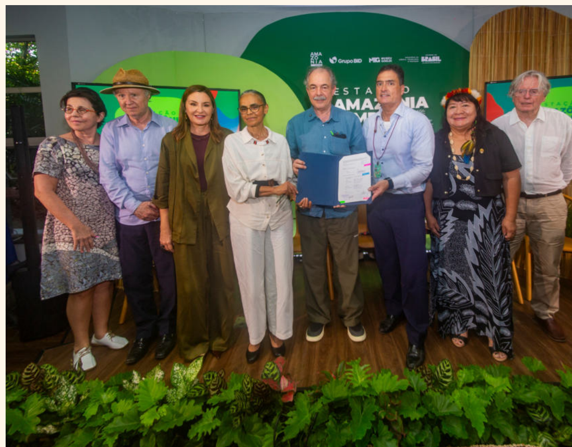
MINISTRA MARINA SILVA E AUTORIDADES POSAM PARA FOTO APÓS ASSINATURA DO CONTRATO DE DOAÇÃO AO FUNDO AMAZÔNIA

Road to Belem começou a ser traçado muito antes de novembro de 2025. Quando o Brasil foi anunciado como sede da COP30, a Suíça enxergou ali muito mais do que um evento diplomático: viu uma oportunidade histórica de fortalecer pontes, gerar impacto concreto e reafirmar, em solo amazônico, seu compromisso com a sustentabilidade. Assim nasceu o programa Road to Belém, uma iniciativa ousada e integrada, coordenada pela Embaixada da Suíça no Brasil, que mobilizou instituições, pesquisadores, empreendedores, artistas e comunidades locais em torno de um mesmo propósito: transformar diálogo em ação.