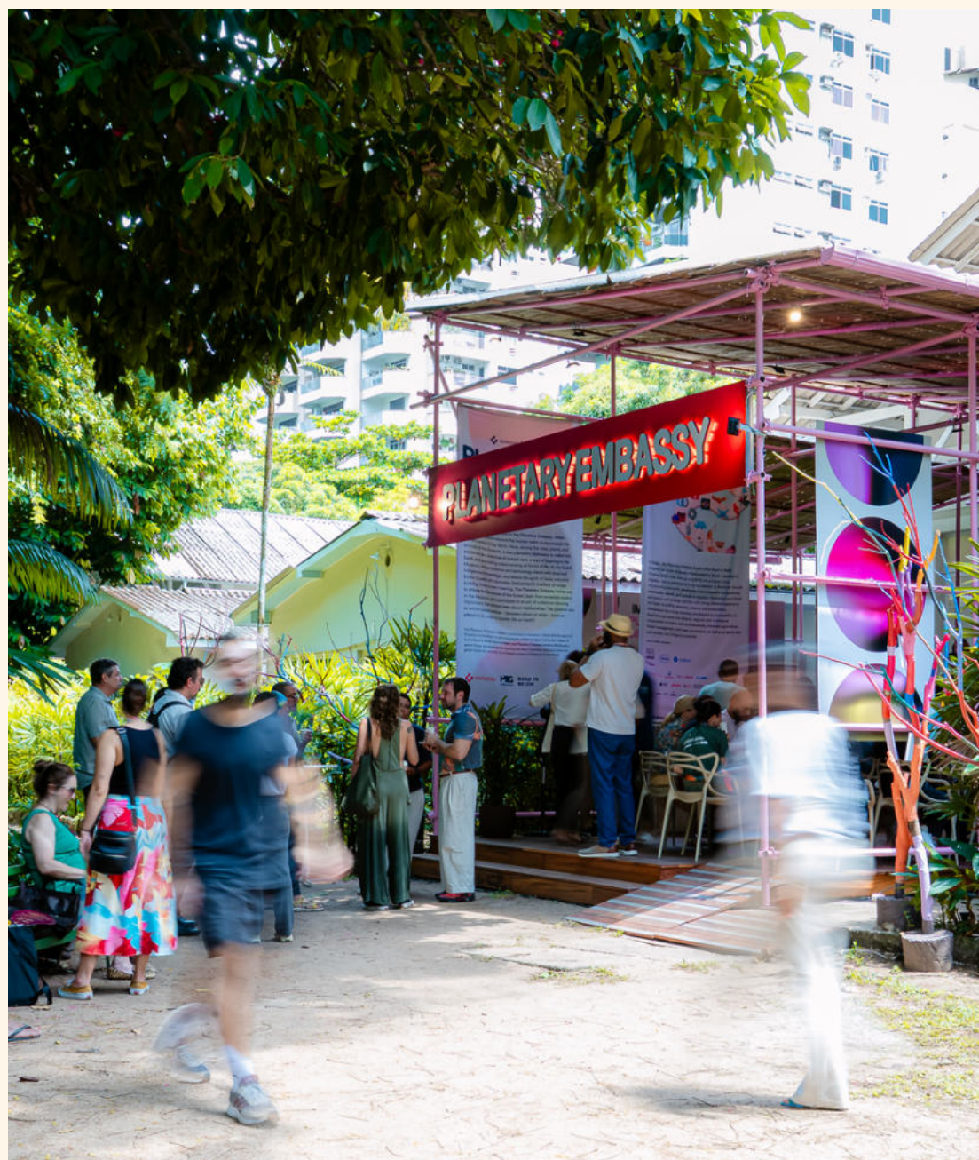
Planetary Embassy por Swissnex no Brasil para a COP30

Em maio, realizamos o workshop 'Seeing the Unseen' com o