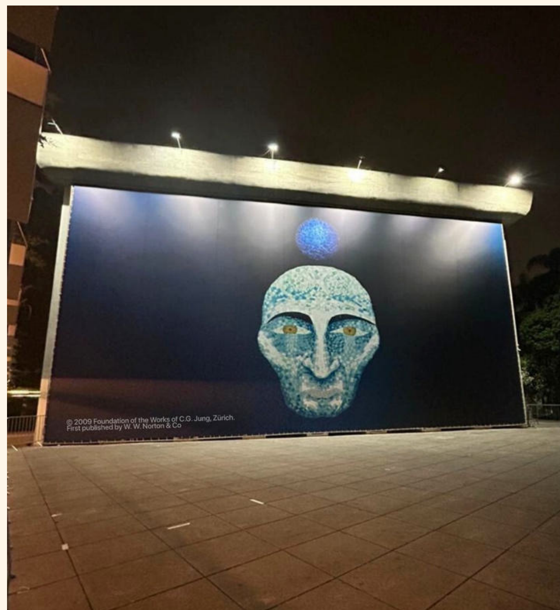
Foto: Fachada MIS/SP, imagem 133 Livro Vermelho, cedida pelo bisneto de Jung, Carl Gustav Jung.