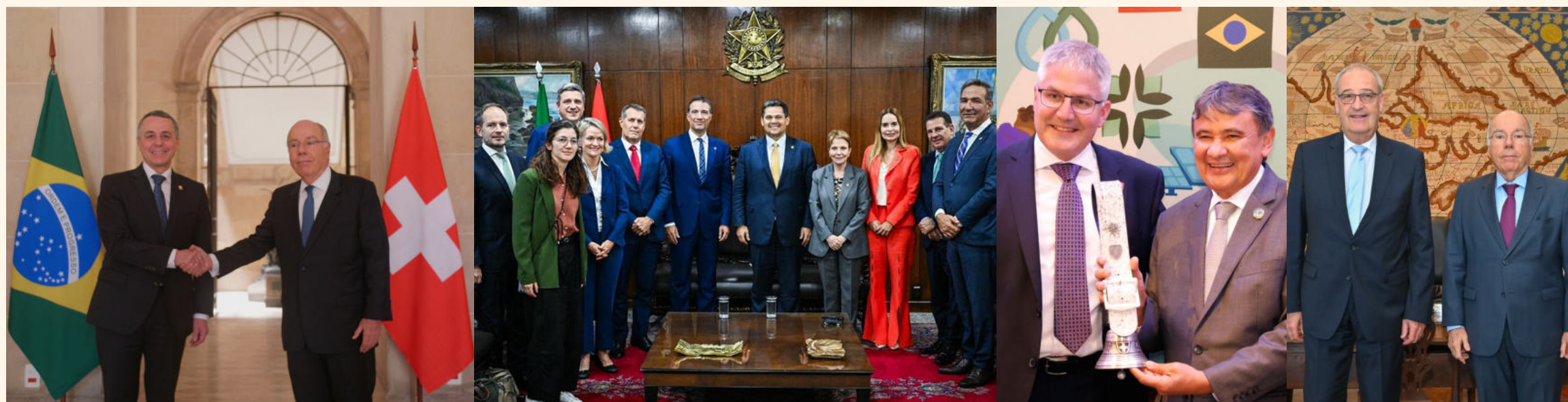
Momento de encontro de autoridades suíças e brasileiras ao longo de 2025