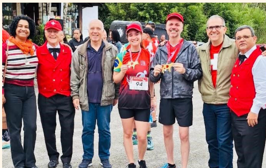
O CÔNSUL-GERAL FOI UM PARTICIPANTE DA CORRIDA