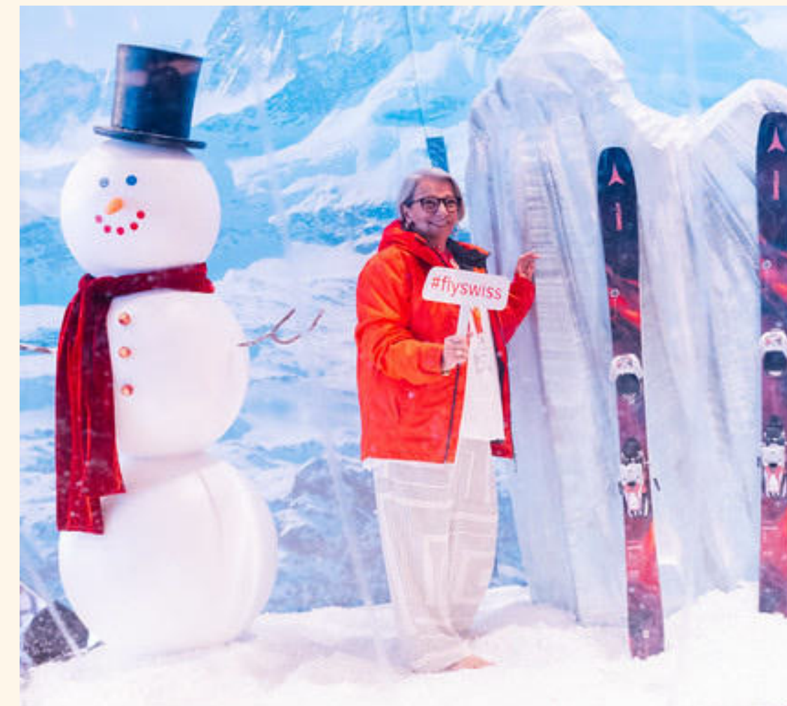
CONVIDADA APROVEITA A "NEVE" DOS ALPES

O feedback registrado pelos participantes foi amplamente positivo. Muitos operadores destacaram que o STE ofereceu exatamente o tipo de informação e de contato necessário para o planejamento de vendas de 2025. Agentes de viagens de diferentes estados ressaltaram a organização, o acesso direto a especialistas suíços e a oportunidade de esclarecer dúvidas específicas sobre roteiros, mobilidade, atrações sazonais e produtos de nicho.