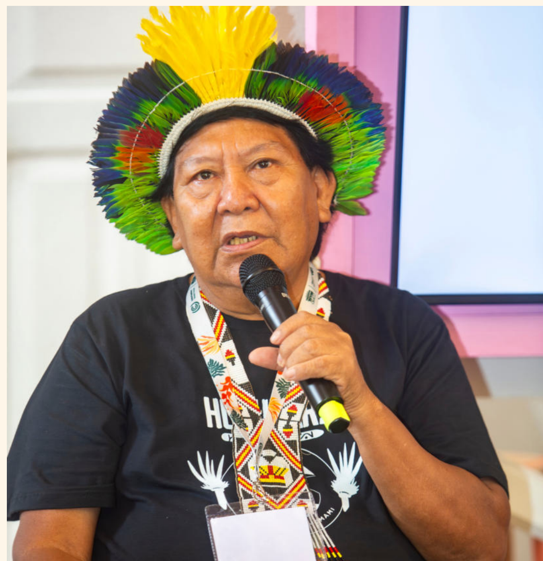
DAVI KOPENAWA