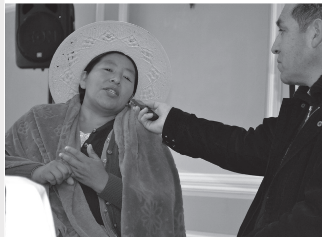
Aprendiendo técnicas de entrevista

-Contribuir y fortalecer la cultura de comunicación en la comunidad para democratizar las relaciones de convivencia armónica de y en la Madre Tierra.