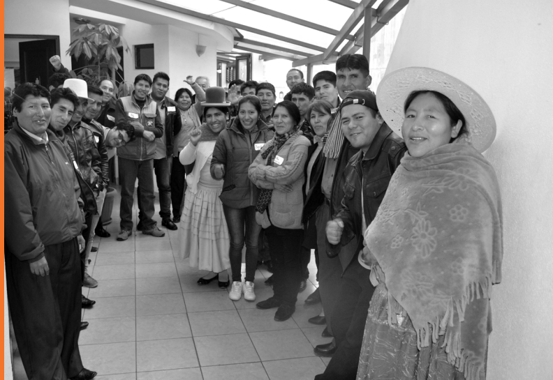
Comunicadores participantes del taller

Este es, definitivamente, un logro del municipio, después de muchos años de lucha en el cual la mujeres no tenían mucha participación visible. Hoy en día participan activamente en el ámbito económico, político, social y productivo de sus comunidades y, de esta manera, muchas se han reconocidos como líderes y jefas del hogar. Facilitando estos procesos de empoderamiento de la mujer, vamos por el camino de la equidad de género en Yunchará.