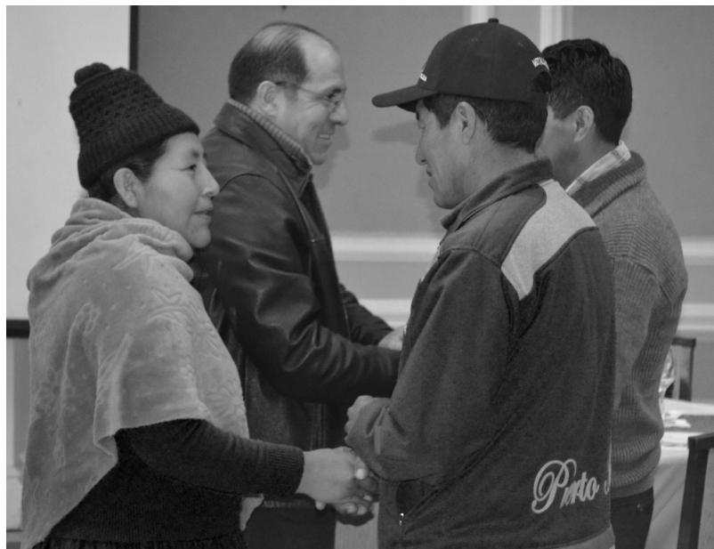
Dinámica "del abrazo" durante el taller