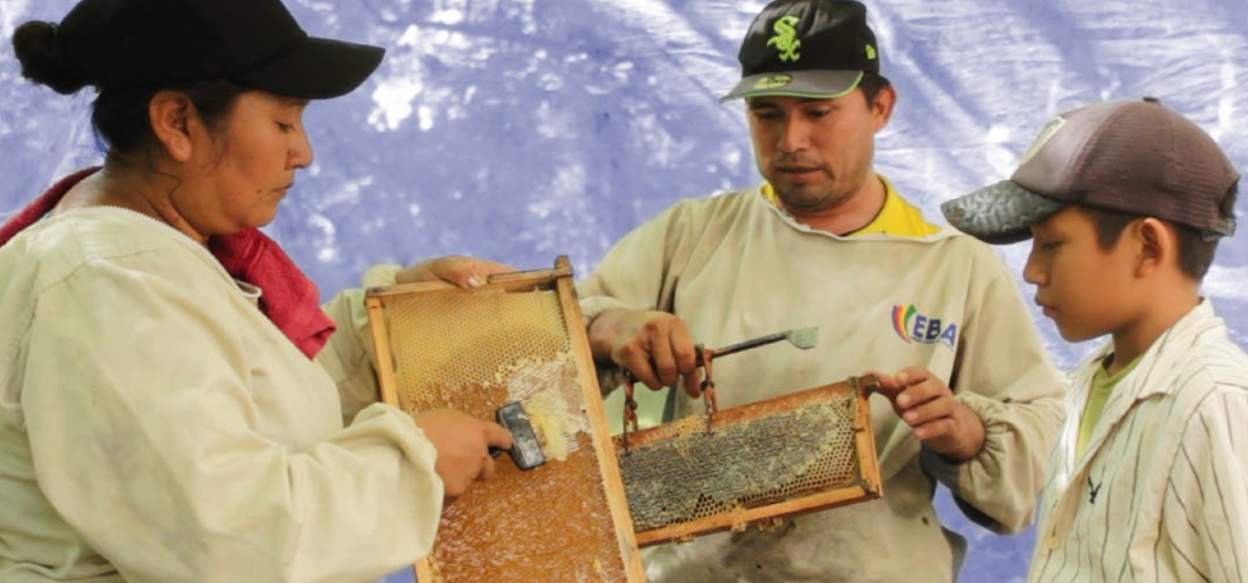
Apicultores de Machareti muestran el proceso de desoperculación. Proyecto Mercados y alianza por la apicultura sostenible en el Municipio de Machareti ejecutado por el IPDRS.

y conocimientos. Asimismo, busca promover iniciativas innovadoras basadas en la investigación aplicada, el análisis y evidencia técnica, con el propósito de que brinden soluciones a los problemas nuevos y antiguos de Bolivia.