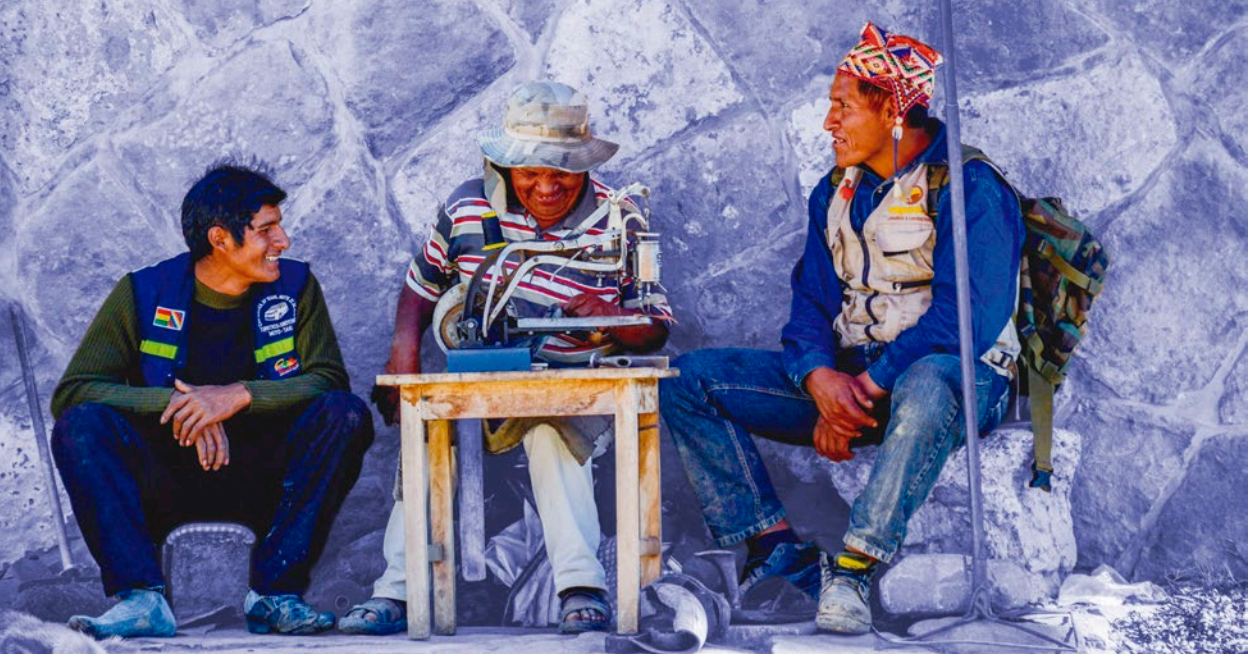
Diálogo intergeneracional, representado por un joven, un señor y un zapatero en la ciudad de La Paz.