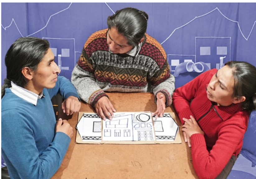
Actores de Mara Teatro en la obra "Por encima de todo", demostrando que el diálogo es el mejor camino para avanzar hacia un desarrollo inclusivo y sostenible.

Con el fin de impulsar y fortalecer este esfuerzo, la Cooperación Suiza ha desarrollado y lleva adelante el proyecto Diálogo y Apoyo Colaborativo (DAC). Esta iniciativa, implementada por Solidar Suiza, alienta a que las organizaciones de la sociedad civil, particularmente las ONG, fundaciones y redes bolivianas trabajen de manera coordinada con el Estado, el sector privado