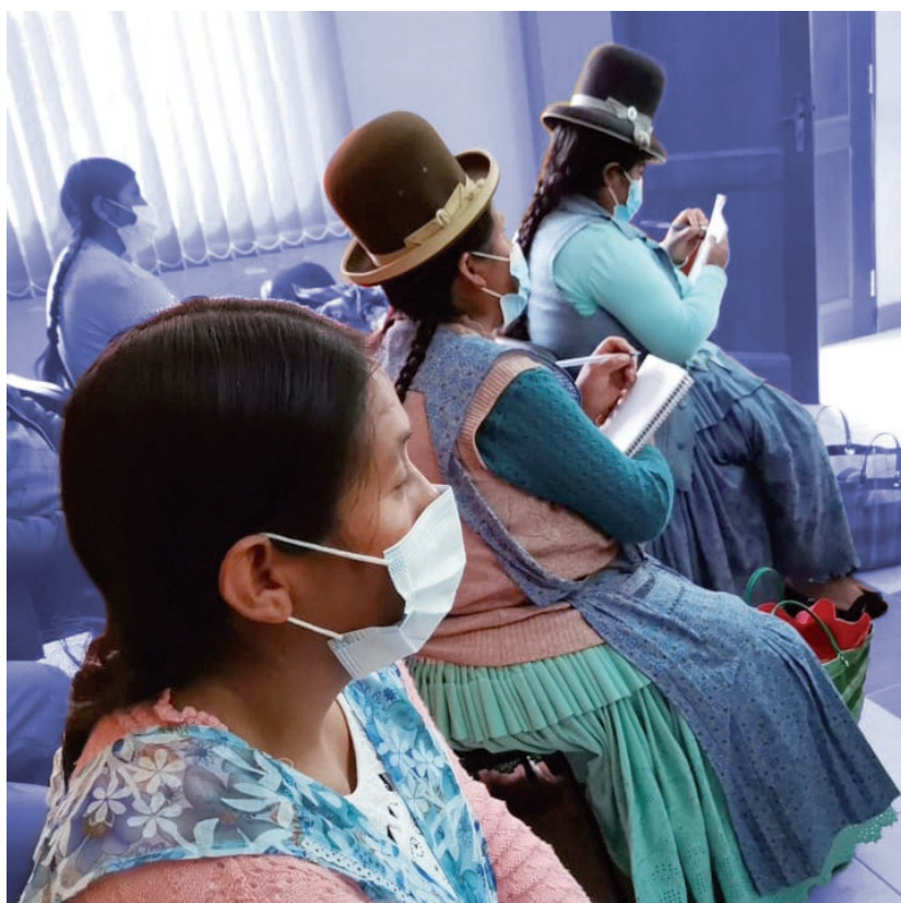
Mujeres del municipio de La Paz participan del taller sobre Transferencias Público Privadas, realizado por la Fundación Jubileo en el marco del Proyecto DAC Diálogo y Apoyo Colaborativo.

La alianza con el Pacto Global contribuye a que las ONG, fundaciones y redes de ONG se involucren con el sector privado, a través de mesas de trabajo que articulan al sector privado, el Estado y la sociedad civil en temáticas como los Derechos Humanos, transparencia y medio ambiente, entre otras.