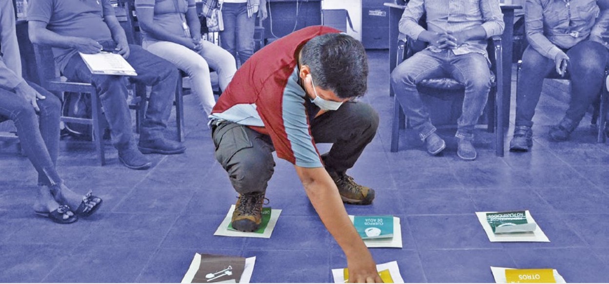
Participante de la capacitación sobre la herramienta ECODATOS en el marco del proyecto Bases del conocimiento para la restauración de la Fundación para la Conservación del Bosque Chiquitano.

la pandemia del Covid-19 y ii) Fortalecimiento organizacional , con propuestas orientadas a desarrollar o fortalecer las capacidades de las ONG y/o fundaciones en su gestión organizacional, gobernabilidad interna, sostenibilidad financiera y diálogo e incidencia.