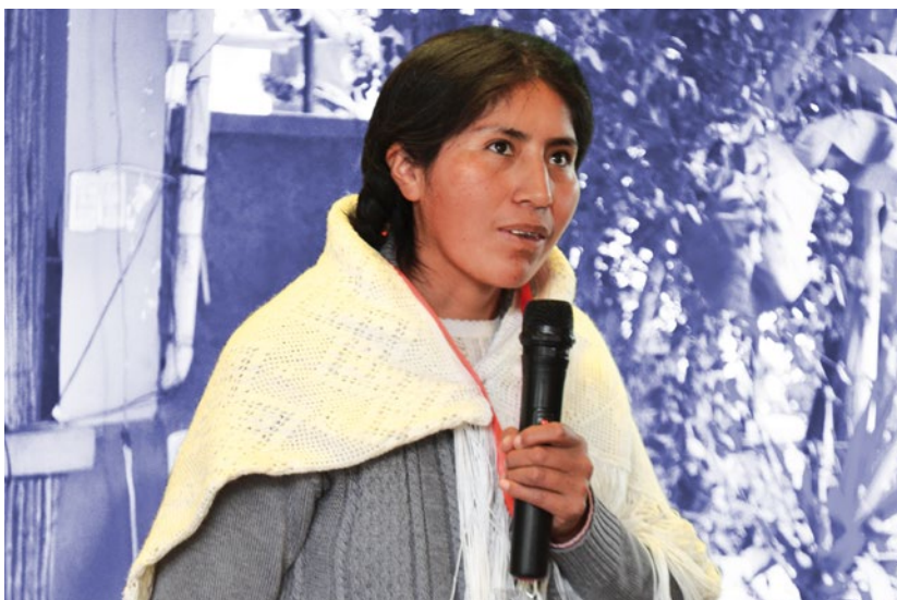
Mujer participa del taller de empleo, realizado por Solidar Suiza

El proyecto DAC promueve que el Estado, sociedad civil, sector privado y academia puedan contar con el apoyo necesario para que piensen y trabajen juntos en el planteamiento de soluciones que presentan los desafíos clave que afronta el desarrollo inclusivo y sostenible; para que sumen sus fuerzas