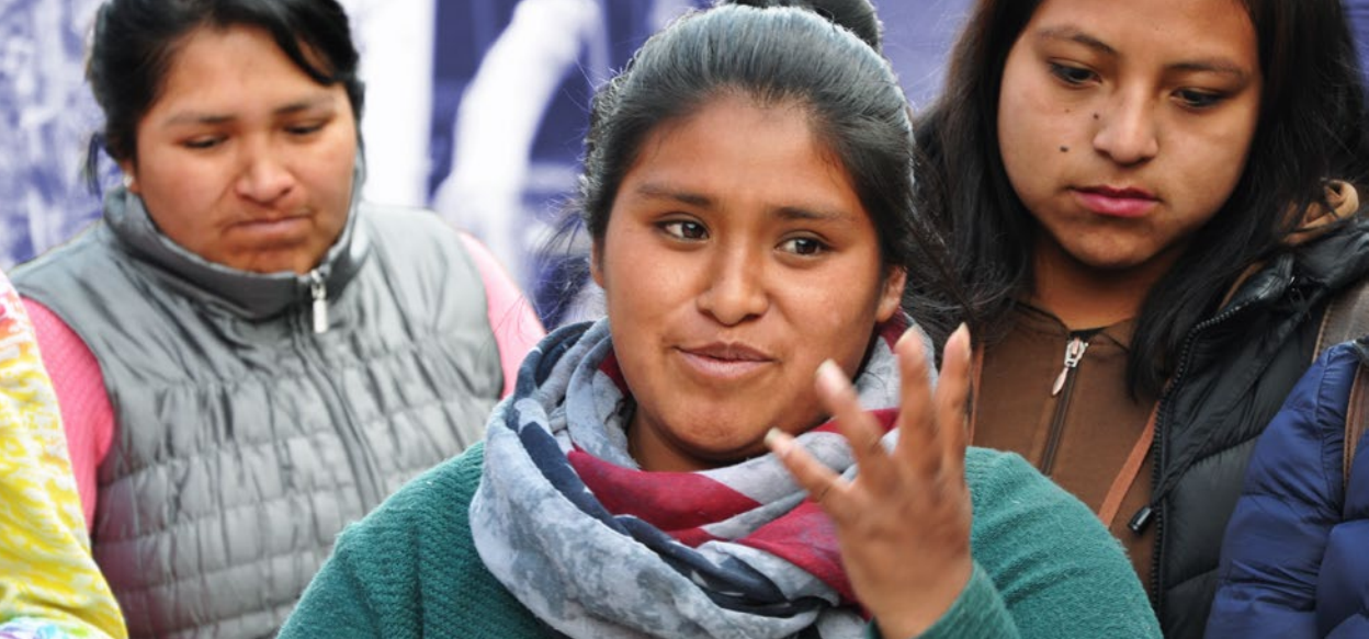
Jóvenes de Viacha dialogan sobre oportunidades de empleo. Proyecto Ch'ama Wayna, Solidar Suiza.