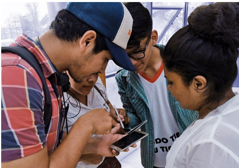
Jóvenes de Cobija participan del taller de herramientas digitales para comunicación.

i) Asuntos clave de desarrollo en los ejes temáticos de Gobernabilidad, desarrollo económico y Cambio climático y Medio Ambiente. En esta sección se incluye, además, la temática específica de pueblos y naciones indígenas de tierras bajas y, dado el contexto actual, propuestas innovadoras que permitan enfrentar y mitigar los efectos de