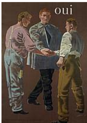
Faire Preise, faire Löhne - litografia di Hans Erni 1949. © J.C.Mueller AG Zurigo

Dopo la seconda guerra mondiale sia le importazioni che le esportazioni aumentarono in modo vertiginoso. L'industria rimase a lungo il principale settore economico (macchinari e metallurgia, chimica, agroalimentare, orologi, tessili) e nel 1970 occupava ancora il 46 per cento della popolazione attiva. Il settore terziario iniziò a dominare la vita economica del Paese a seguito della recessione degli anni 1970.